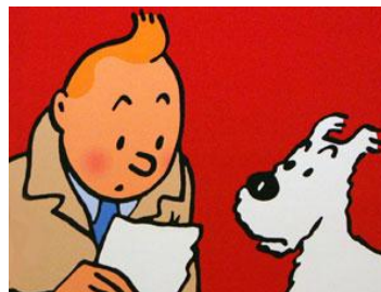
Gambar 1.kantun Tintin

Penggambaran pada buku panduan ini dilakukan secara hand-drawn dengan menggunakan pensil. Gambar tersebut dibuat berdasarkan storyboard yang telah dibuat sebelumnya. Untuk pewarnaan akan dilakukan secara manual menggunakan perpaduan pensil warna, sepidol. Kemudian finishing dilakukan dengan penggunaan software .