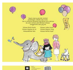
Gambar 5 Layout Sampul Depan dan Sampul Belakang