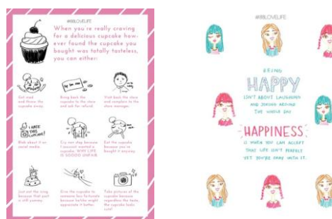
Gambar 2.Reverence Layout yang digunakan

Gaya layout yang akan digunakan adalah gaya modern yang menggunakan tambahan ornamen seperti patren sebagai background . Dan ditumpuk dengan tambahan layout di beberapa bagian. Penataan untuk visualnya tetap simetris sehingga tetap terkesan rapi.