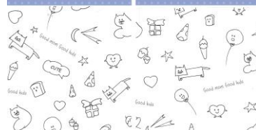
Gambar 4. Layout Isi Buku