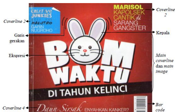
Gambar 4. Main image dan main coverline Intisari 2011

Cover majalah Intisari edisi Januari 2011 menggabungkan antara main image dan main coverline , dimana huruf “O” pada tulisan “BOM WAKTU” diganti menjadi kepala kelinci. Kepala kelinci digambarkan dengan kepala mahluk berwarna putih yang memiliki telinga panjang dengan area merah muda di dalamnya, mata bulat dan hitam, hidung merah, dan kumis, dikenal sebagai kelinci. Ekspresi kelinci tersenyum. Gambar ilustrasi menggunakan garis yang tegas. Gaya visual pada ilustrasi kelinci dalam cover lebih terlihat menggunakan pendekatan gaya ilustrasi barat.