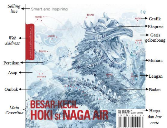
Gambar 5. Main image dan main coverline Intisari 2012