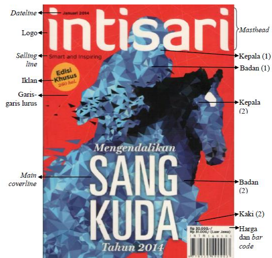
Gambar 6. Main image dan main coverline Intisari 2014

Main image pada sampul terdiri dari gabungan dua makhluk yaitu manusia sebagai pengendara dan kuda sebagai yang ditunggangi. Terdapat perubahan gaya visualisasi pada main image , dimana edisi tahun 2014 bersifat lebih abstrak. Objek pertama adalah manusia sebagai pengendara yang digambarkan berada di atas kuda (menunggang kuda) ekspresi wajah manusia tidak ditunjukkan seperti halnya kuda. Meskipun begitu wajah kuda masih terlihat, meskipun tidak berekspresi. Manusia tampak sedang menggunakan pelindung kepala yang biasanya digunakan untuk berkuda.