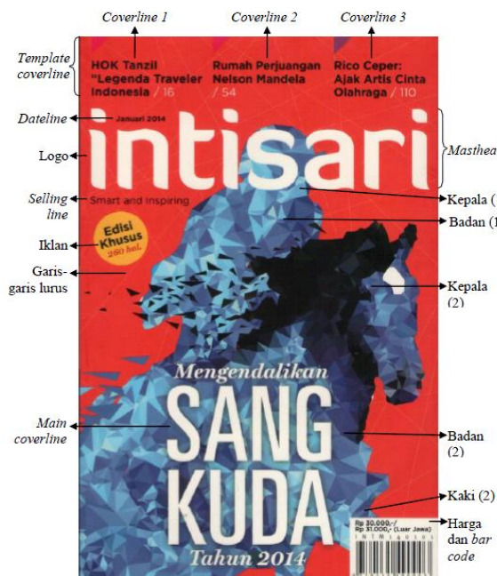
Gambar 9. Cover Intisari edisi Januari 2014

Penataan coverlines pada edisi ini, tidak berbeda jauh dengan edisi Januari 2012. Typeface , penempatan, dan struktur penulisan tetap sama, tetapi terdapat