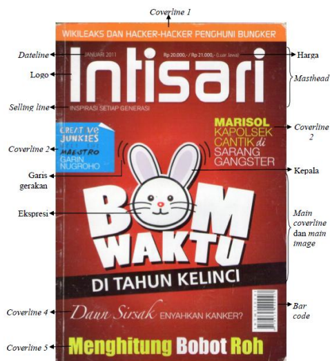
Gambar 7. Cover Intisari edisi Januari 2011

Pada cover edisi Januari tahun 2011 terdapat 5 coverlines dengan penempatan dan visual yang berbeda-beda. Coverline pertama terdapat di bagian atas, ditulis dengan huruf kapital tebal seluruhnya menggunakan typeface yang sama seperti logo yaitu Sol Pro. Coverline yang berjudul “WIKILEAKS DAN HACKER-HACKER PENGHUNI BUNGER” menggunakan putih sebagai warna tulisan di atas bidang persegi panjang berwarna jingga. Wikileaks merupakan nama organisasi hacker yang sekaligus aktivis yang menciptakan kehebohan beberapa bulan terakhir (Januari 2011). Penambahan keterangan mengenai Wikileaks pada judul coverline terdapat pada kata-kata setelah “WIKILEAKS”, yakni dijelaskan bahwa Wikileaks berkaitan dengan hacker yang menempati/mendiami (bekerja di) bunker.