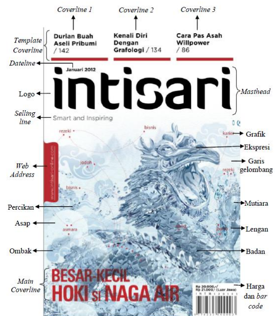
Gambar 8. Cover Intisari edisi Januari 2012

Penempatan coverlines pada edisi ini berubah sesuai dengan adanya perubahan layout , dimana semua 3 coverlines diletakkan di atas garis merah yang diletakkan di atas logo majalah. Typeface Gotham dengan warna hitam dan huruf kapital pada setiap kata dalam judul dapat ditemukan pada visual coverlines . Nomor halaman artikel yang judulnya dimuat pada cover dicantumkan setelah teks judul artikel dengan typeface dan warna yang sama, namun dalam jenis light (tipis).