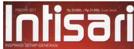
Gambar 1. Masthead Intisari tahun 2011