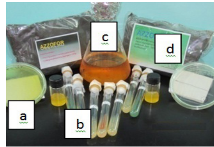
Gambar 1. Isolat bakteri fungsional ( Functional of bacterial isolates ): (a) isolasi bakteri ( bacterial isolation ), (b) isolat murni ( pure isolates ), (c) inokulan cair ( liquid inoculant ), dan (d) inokulan padat ( Azzofor-wd3 ) ( solid inoculant (Azzofor-wd3) )

Inokulan padat Azzofor-wd3 merupakan campuran 16 isolat bakteri indigenus lahan gambut ( Rhizobium , Azotobacter , Azospirillum , dan BPF) masing-masing empat isolat yang digunakan sebagai pupuk hayati. Isolat BPNS, BPNNNS, dan BPF murni dengan efektivitas teruji dalam melarutkan fosfat terikat yang ditandai dengan terbentuknya zona bening, ditumbuhkan pada media natrium agar cair dan diinkubasikan selama 7 hari sambil dikocok dengan shaker pada kecepatan 120 rpm. Jumlah populasi bakteri BPNS, BPNNNS, dan BPF dalam inokulan