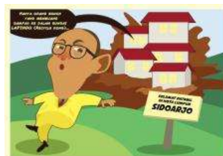
Gambar 2. Konsep Karakter Pada Final Perancangan