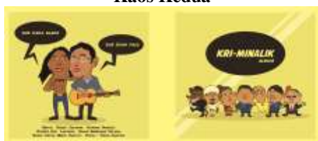
Gambar 11. Penerapan Desain Karya Pada Sampul Kotak CD