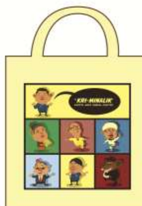
Gambar 8. Penerapan Desain Karya Pada Tas Kain Kedua