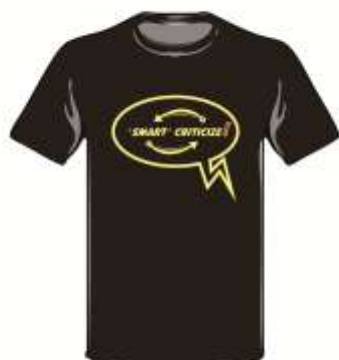
Gambar 10. Penerapan Desain Karya Pada Media Kaos Kedua