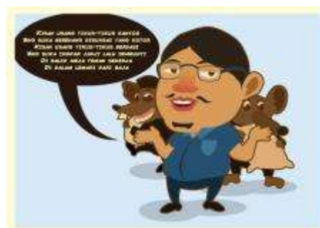
Gambar 3. Konsep Karakter Pada Final Perancangan