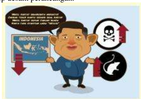
Gambar 1. Konsep Karakter Pada Final Perancangan

Karakter yang ditampilkan disesuaikan dengan apa yang terhubung dengan lirik lagu kritikan. Karakter yang dibuat sesuai dengan ciri khas wajah, tubuh, busana, dan tingkah laku seperti karakter yang dimaksudkan dalam lagu – lagu kritik sosial politik. Dalam pembuatan karakter, semua pemilihan karakter berasal dari apa yang dihubungkan dengan lirik – lirik dari lagu kritik sosial politik, kemudian disesuaikan dengan yang berada di kehidupan nyata, kemudian dikembangkan dengan gaya desain karakter sesuai konsep desain perancangan.