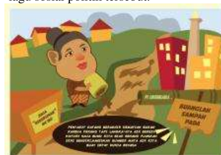
Gambar 4. Konsep Pewarnaan Pada Final Perancangan

Warna yang digunakan pada ilustrasi disesuaikan dengan kondisi fakta sebenarnya seperti warna baju, rambut, dan lain – lain, sesuai dengan ciri khas dari masing karakter yang ada di dalam lagu – lagunya. Misalnya karikatur SBY yang berciri wajah agak memelas dan sering terlihat memakai pakaian warna biru, dan warna rambut yang terlihat agak putih sesuai dengan karakter visual yang terlihat di kehidupan nyata dari semua karakter yang terhubung dengan lagu – lagu sosial politik tersebut.