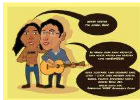
Gambar 6. Desain Sampul Belakang Karya Perancangan

Pada sampul bagian belakang diisi dengan sinopsis kecil beserta rangkuman penjelasan isi buku tersebut tentang apa, gunanya apa, untuk siapa buku tersebut dirancang. Visualnya juga akan menampilkan sedikit ilustrasi karikatur dari karakter – karakter yang dipakai. Pada bagian cover semuanya menggunakan warna colorful.