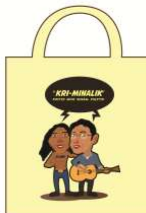
Gambar 7. Penerapan Desain Karya Pada Tas Kain Pertama