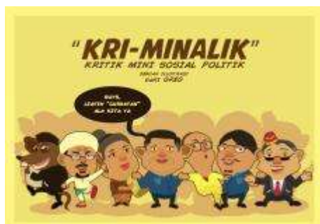
Gambar 5. Desain Sampul Depan Karya Perancangan

Pada sampul bagian depan dari buku kartun opini atau cover bukunya akan terdapat beberapa karikatur dari wajah – wajah yang berhubungan dengan lirik – lirik di lagu bertema kritik sosial politik ciptaan musisi Indonesia. Di covernya, layoutnya akan terlihat, judul buku kartun opini berada di tengah – tengah halaman. Kemudian karakter – karakter karikaturnya mengelilingi judul buku kartun opini tersebut. Warna yang dipakai pada sampul depan akan berwarna colorful menyesuaikan dengan model karikatur dari lagu – lagunya.