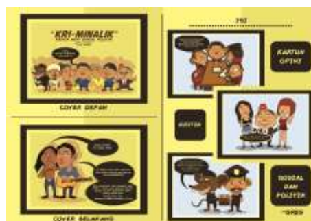
Gambar 13. Penerapan Desain Karya Pada Katalog Bagian Belakang