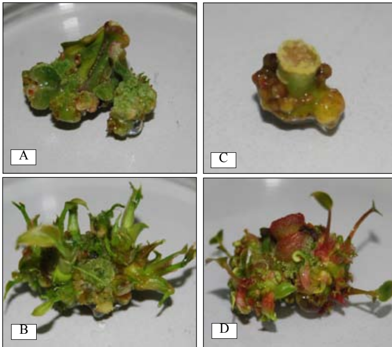
Gambar 1. Respons pertumbuhan dan regenerasi daun dan petiol pada MR-6. A-B, Kalus dari daun sampel tanaman haploid no. 400 dan hasil regenerasinya, C-D, kalus dari petiol sampel tanaman haploid no. 16 dan hasil regenerasinya ( Response of growth and regeneration of young leaf and petiole on MR-6 medium. A-B, callus from leaf of haploid plant no. 400 and its regeneration result, C-D, callus from petiole of haploid plant no. 16 and its regeneration result )

pikloram dan 2 mg/l zeatin pada medium MS dengan 0,1 atau 0,5 mg/l pikloram dan 0,01 mg/l BA merupakan medium regenerasi yang sesuai untuk kultur anther lili (Han et al. 1997). Pada G. jamesonii , peningkatan konsentrasi BAP dari 0,4 menjadi 1,0 mg/l, penurunan konsentrasi NAA dari 4,0 menjadi 2,0 mg/l, dan 3% (w/v) sukrose pada medium MS mampu meningkatkan kemampuan organogenesis kalus hingga 83,3% (Aswath dan Choudhary 2002). Penghilangan 13,5 mg/l 2,4-D pada medium B5 yang mengandung 13,3 \mu M BAP menjadi medium yang optimal untuk regenerasi tunas kedelai (Radhakrishnan dan Ranjithakumari 2007). Peningkatan kekuatan medium dari setengah kekuatan menjadi kekuatan penuh, penggantian peran 2,4-D dan BAP dengan 2,9 \mu mol/l GA 3 , 23,6 \mu mol/l AgNO 3 , 0,02% arang aktif, dan 4,5 \mu mol/l TDZ pada medium MS sesuai untuk regenerasi tunas V. wittrockiana (Wang dan Bao 2007).