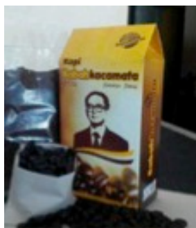
Gambar 2. Data Visual Produk Kopi