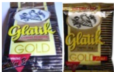
Gambar 3 Data Visual Produk Kopi