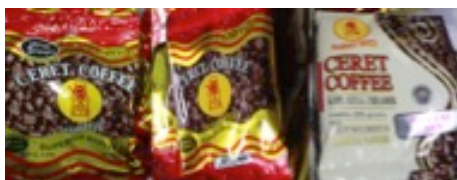
Gambar 1. Data Visual Produk Kopi Cap Ceret