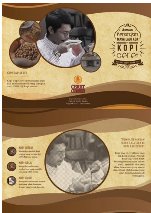
Gambar 6 Eksekusi Brosur