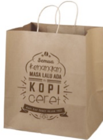
Gambar 14 Eksekusi Shopping Bag

Shopping Bag digunakan untuk setiap pembelian produk kopi Ceret.