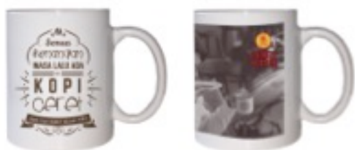
Gambar 8 Eksekusi Mug

Mug berfungsi sebagai media promosi tambahan yang digunakan sebagai souvenir dalam pembelian kopi Ceret.