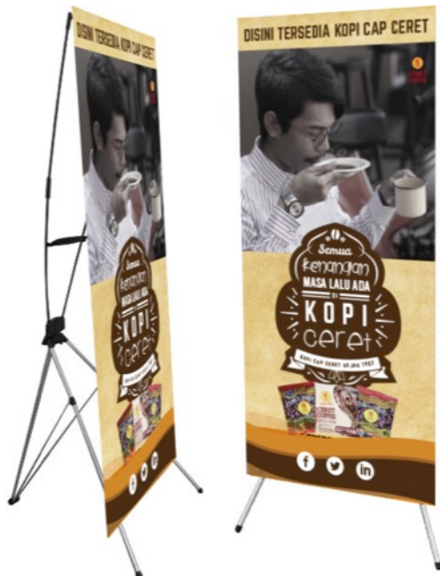
Gambar 12 Eksekusi Xbanner

Xbanner berfungsi untuk digunakan sebagai media promosi di depan toko, swalayan maupun rumah makan.