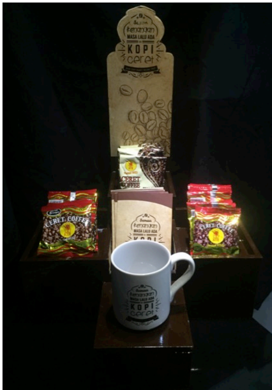
Gambar 13 Eksekusi POP

POP merupakan suatu media yang berfungsi untuk memajang produk kopi Ceret sehingga dapat terlihat lebih menarik.