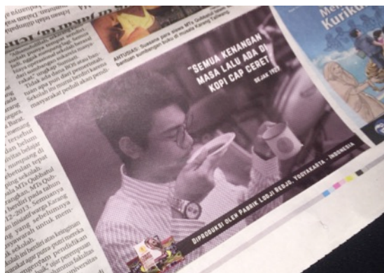
Gambar 4 Eksekusi Iklan Koran di Koran Jawa Pos

Iklan Koran ini akan dipasang di Jawa Pos Nasional selama 6x. Fungsi iklan Koran ini berfungsi untuk menarik target audience dengan jangkauan luas.