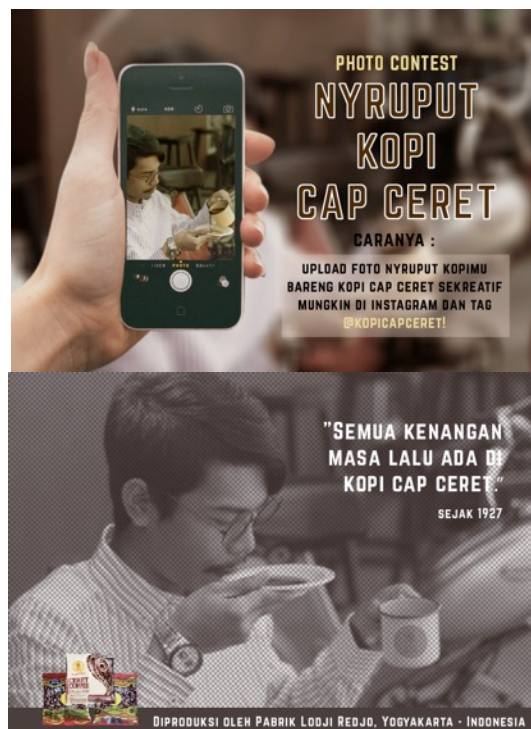
Gambar 5 Eksekusi Iklan Koran