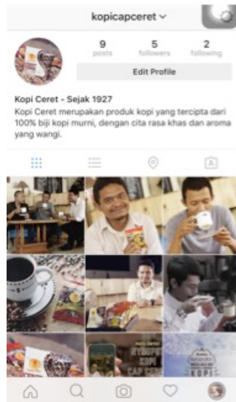
Gambar 15 Eksekusi Media Sosial