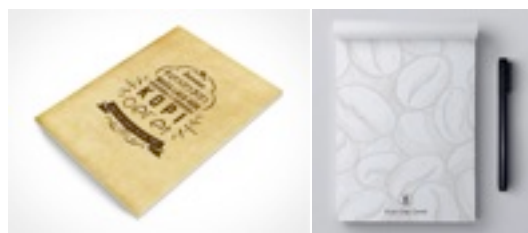
Gambar 9 Eksekusi Notes

Notes berfungsi sebagai media promosi tambahan yang dapat digunakan sebagai souvenir sehingga masyarakat dapat lebih tertarik dalam membeli produk kopi Ceret.