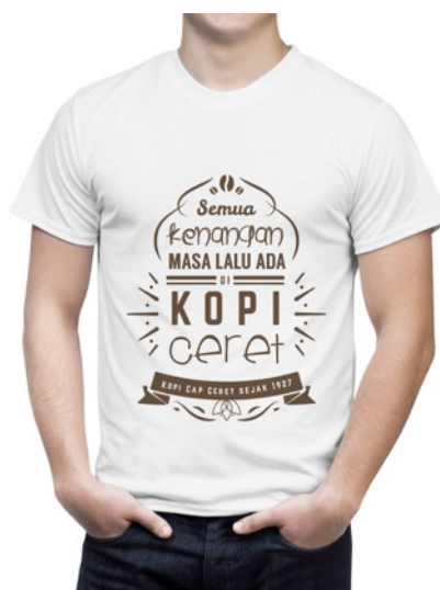
Gambar 11 Eksekusi Tshirt

Tshirt berfungsi untuk dibagikan kepada beberapa toko yang menjual produk kopi Ceret. Fungsi baju ini digunakan oleh pegawai-pegawai toko.