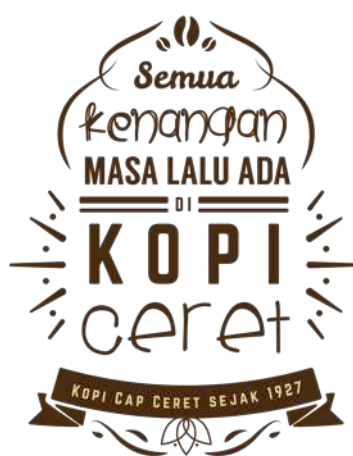
Gambar 10 Eksekusi Stiker

Stiker berfungsi untuk diberikan dalam pemberian produk kopi Ceret.