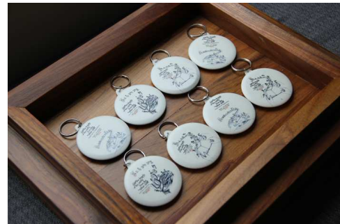
Gambar 8. Gantungan Kunci Triwulan Event