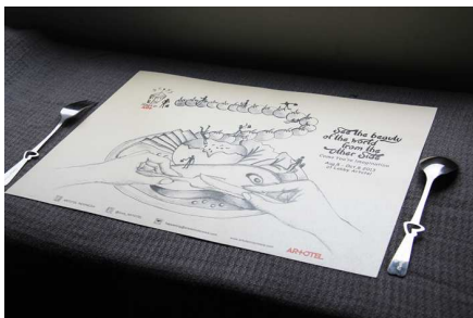
Gambar 5. Placemat Triwulan Event