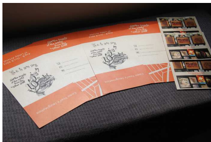
Gambar 6. Brosur Triwulan Event