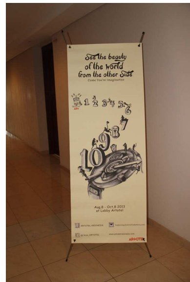
Gambar 9. X-Banner Triwulan Event