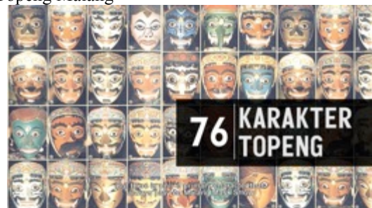
Gambar 17. Capture 14 Film “Ngepot Ngalam”

Sequence 14: Penjelasan beberapa karakter dari tari Topeng Malang