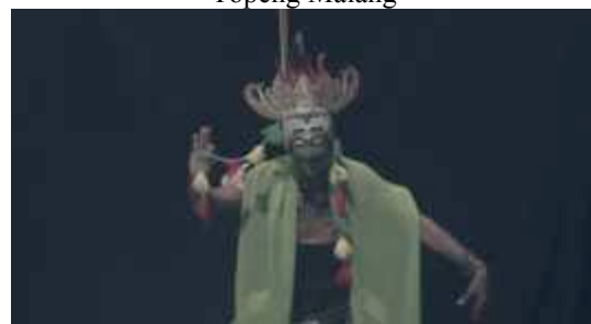
Gambar 18. Capture 15 Film “Ngepot Ngalam”

Sequence 15: Pembagian peranan dalam tari Topeng Malang