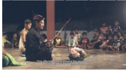
Capture 15. Capture 12 Film “Ngepot Ngalam”

Sequence 12: Dimulainya Pertunjukan Gebyak