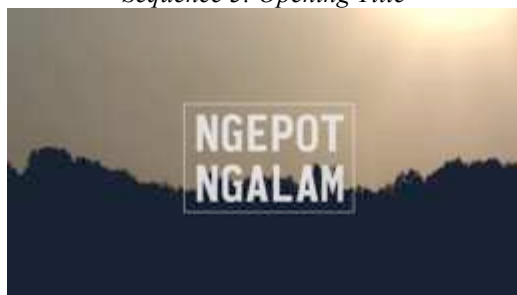
Gambar 6. Capture 3 Film “Ngepot Ngalam”