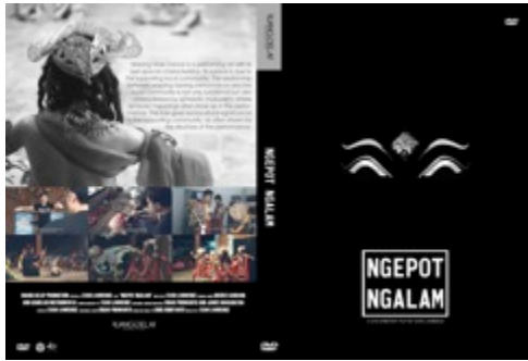
Gambar 25. Cover DVD