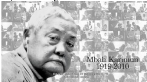
Gambar 10. Capture 7 Film “Ngepot Ngalam”