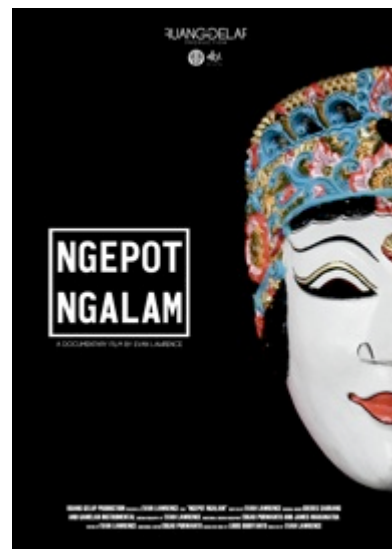
Gambar 24. Poster Film