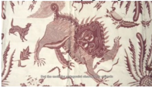
Gambar 19. Capture 16 Film “Ngepot Ngalam”

Sequence 16: Penjelasan motif yang digunakan pada bentuk Topeng Malang