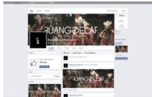
Gambar 28. Fanpage Facebook