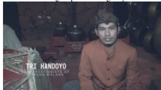
Gambar 16. Capture 13 Film “Ngepot Ngalam”

Sequence 13: Sejarah singkat dari Topeng Malang dan segala perkembangannya