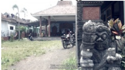
Gambar 9. Capture 6 Film “Ngepot Ngalam”