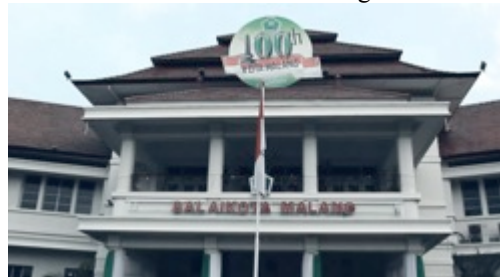
Gambar 7. Capture 4 Film “Ngepot Ngalam”