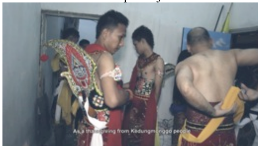
Gambar 14. Capture 11 Film “Ngepot Ngalam”

Sequence 11: Pertunjukan Gebyak dan persiapan sebelum pertunjukan