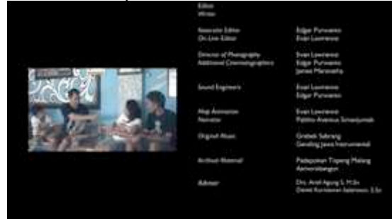
Gambar 23. Capture 20 Film “Ngepot Ngalam”

Selain itu, media pendukung yang dibuat antara lain seperti poster film, cover dan label DVD, poster mind mapping, serta Fanpage facebook.