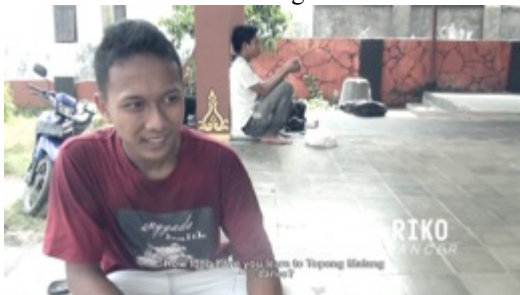
Gambar 12. Capture 9 Film “Ngepot Ngalam”

Sequence 9: Wawancara salah satu Penari Topeng Malang