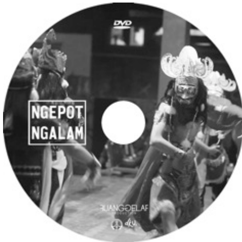
Gambar 26. Label DVD