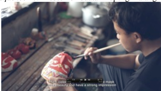
Gambar 13. Capture 10 Film “Ngepot Ngalam”

Sequence 10: Proses Pembuatan Topeng Malang