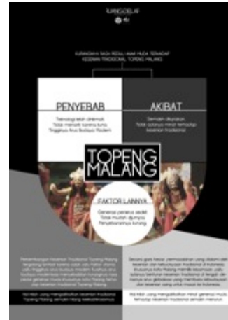
Gambar 27. Poster Mind Map