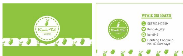
Gambar 10. Desain kartu nama