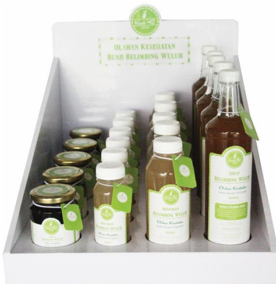
Gambar 9. Display