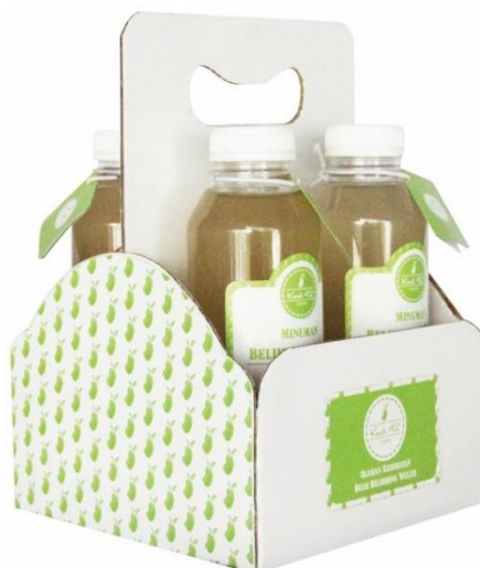
Gambar 6. Desain kemasan sekunder minuman