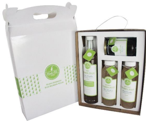
Gambar 7. Desain kemasan sekunder gabungan