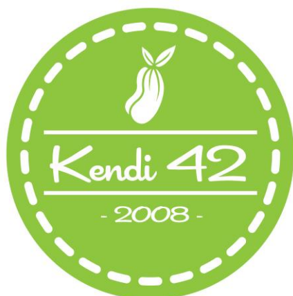
Gambar 2. Logo Kendi 42

Untuk mendukung konsep yang diangkat dalam perancangan ini, maka logo akan didesain ulang sesuai dengan konsep. Konsep dalam mendesain logo yaitu menggunakan bentuk dasar lingkaran dengan gambar belimbing wuluh. Tampilan gambar belimbing wuluh dibuat sederhana sehingga terlihat modern dan menarik. Lalu typeface yang digunakan yaitu Cocktail Shaker. Pemilihan jenis typeface ini karena mempunyai kesan tradisional. Warna yang digunakan pada logo yaitu hijau muda dan putih. Penggunaan warna hijau muda karena sesuai dengan buah dari belimbing wuluh. Sedangkan warna putih memberikan kesan higienis dan bersih.