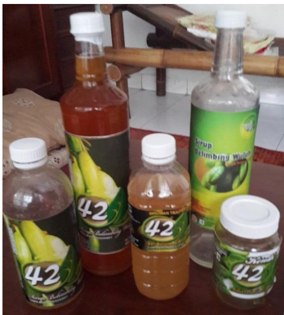
Gambar 1. Kemasan lama Kendi 42

Untuk memberikan gambaran yang lebih jelas mengenai desain kemasan yang telah digunakan, berikut contoh desain kemasan yang selama ini digunakan oleh Kendi 42.