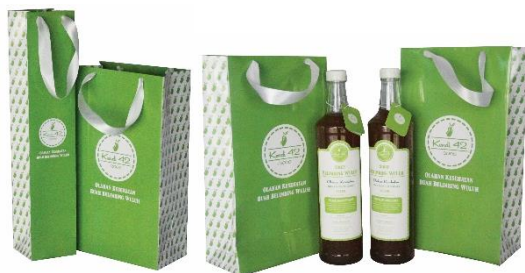
Gambar 8. Desain Paperbag