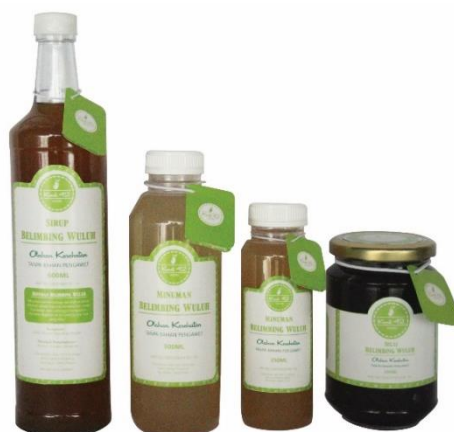
Gambar 5. Desain kemasan primer

Setelah pembuatan thumbnail, dilakukan pengembangan desain hingga final . Konsep yang diangkat melalui kemasan Kendi 42 adalah kemasan yang alami tradisional, higienis namun dikemas dengan lebih modern. Selain itu tentunya kemasan dapat memberikan citra sebagai produk penunjang kesehatan. Untuk mendukung konsep, maka digunakan ilustrasi pattern dari belimbing wuluh. Berikut ini final desain dan media pendukung Kendi 42 :