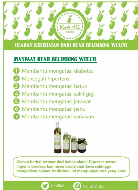
Gambar 11. Desain Flyer