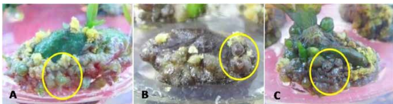
Gambar 2. Bentuk nodul manggis pada tiga media dasar: (A) media MS, (B) media WPM, dan (C) media B5 (Performance of mangosteen nodules on three basal media: (A) MS medium, (B) WPM medium, and (C) B5 medium)

Angka pada baris yang sama yang diikuti oleh huruf kecil yang sama menunjukkan tidak berbeda nyata menurut uji DMRT pada taraf 5%, sedangkan angka pada kolom yang sama yang diikuti oleh huruf kapital yang sama menunjukkan tidak berbeda nyata menurut uji DMRT pada taraf 5% (Mean at the same row followed by the same small letters were not significantly different at 5% level based on DMRT test, while mean at the same column followed by the same capital letters were not significantly different at 5% level based on DMRT test)