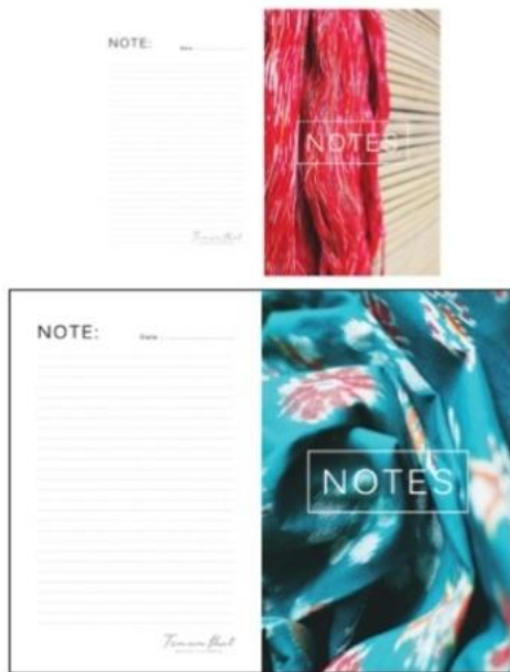
Gambar 6. Desain notes