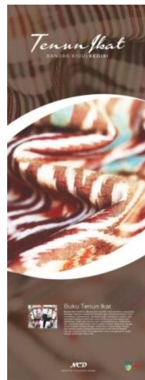
Gambar 8. Desain x-banner