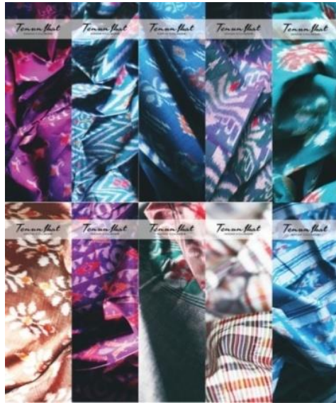
Sumber: Novita Condro Dewi, 2014 Gambar 5. Desain pembatas buku