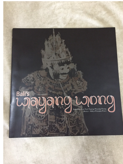
Gambar 2. Cover Buku