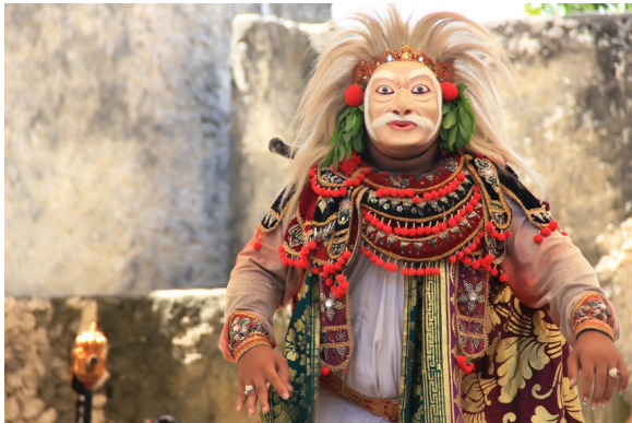
Gambar 1. Tari Topeng Wayang Orang

kegiatan seni dan adat sehari-hari. Cerita klasik Ramayana dan cerita Panji yang berkembang sejak ratusan tahun lalu menjadi inspirasi utama dalam penciptaan topeng di Jawa. Topeng-topeng di Jawa dibuat untuk pementasan sendratari yang menceritakan kisah-kisah klasik tersebut.