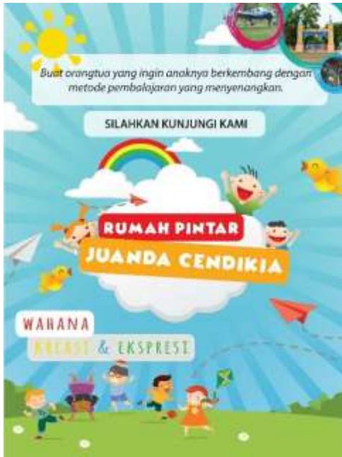
Gambar 6. Brosur Tampak Depan