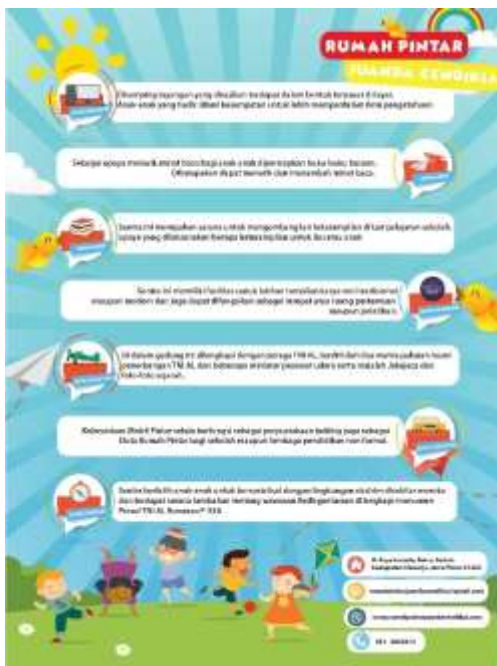
Gambar 7. Brosur Tampak Belakang