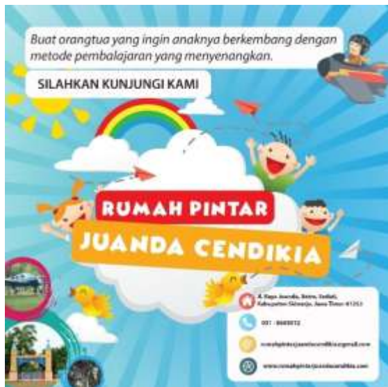
Gambar 8. Poster di Media Sosial Instagram