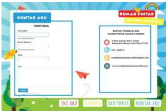
Gambar 5. Final Kontak