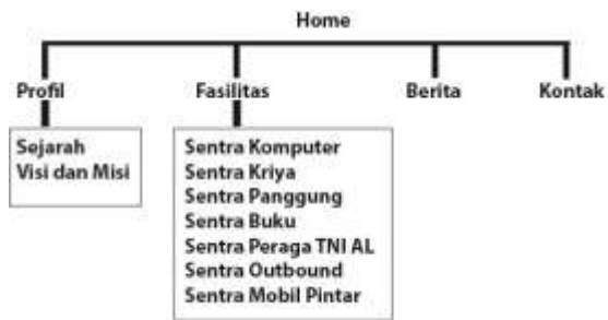
Gambar 1. Alur Desain Interaktif