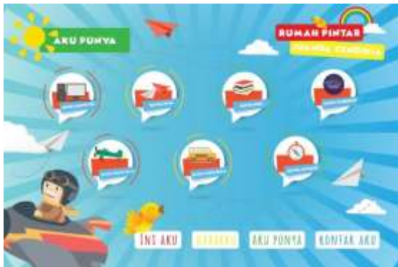
Gambar 4. Final Halaman Fasilitas