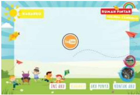
Gambar 3. Final Halaman Tentang Kami