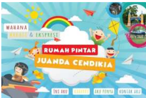
Gambar 3. Final alaman Utama