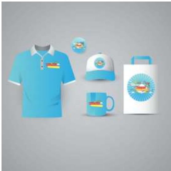
Gambar 9. Merchindase