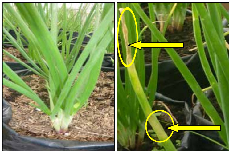
Gambar 1. Tanaman yang sehat sebelum terserang penyakit antraknos pada 14 HST (kiri), tanaman yang terserang penyakit antraknos pada 40 HST (kanan) [ Healthy plant before attracted antrachnose disease at 14 DAP (left), antrachnose diseased plant at 40 DAP (right) ]

Serangan penyakit berlangsung sampai umur 80 hari atau 11 MST. Daun-daun yang terserang antraknos berwarna kuning mulai dari ujung daun terus menyebar ke bagian bawah. Untuk menyelamatkan tanaman bawang merah dilakukan perompesan daun-daun yang terserang dan dilakukan penyemprotan fungisida.