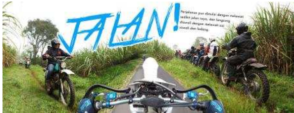
Gambar 4. Desain Layout Buku 2