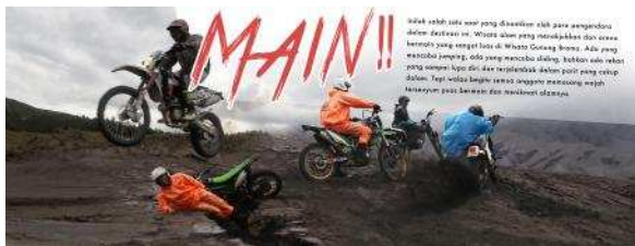
Gambar 6. Desain Layout Buku 4