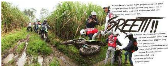
Gambar 5. Desain Layout Buku 3