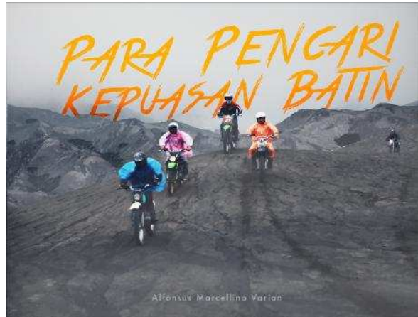
Gambar 1. Desain Cover Depan Buku