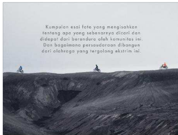
Gambar 2. Desain Cover Belakang Buku