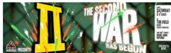
Gambar 1. Banner resmi Surabaya Bowl II

Berikut ini adalah beberapa data visual berupa foto-foto kelengkapan Flag Football , sebagai berikut