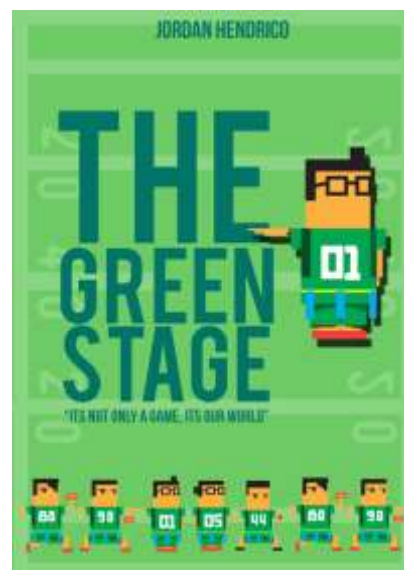
Gambar 8. Katalog