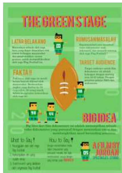
Gambar 7. Poster konsep