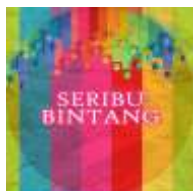
Gambar 9. Pin

Pin berfungsi sebagai media pendukung pada saat pameran atau penayangan film digelar. Strategi yang digunakan adalah diharapkan pin tersebut dapat mengingatkan penonton lepas dari acara ini untuk dapat memberi dukungan secara terus menerus kepada penderita kanker.