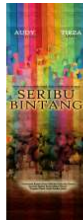
Gambar 11. Xbanner

Xbanner berfungsi sebagai media pelengkap pada saat pameran untuk dapat menarik perhatian pengunjung atau pun penonton. Rasa yang ingin ditimbulkan di pikiran mereka adalah rasa penasaran.