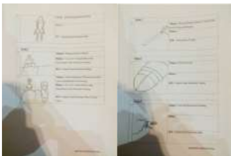
Gambar 3. Treatment

Pada gambar di atas merupakan treatment dari film pendek Seribu Bintang. Setelah melalui tahap storyline , maka ceritanya dikembangkan menjadi per sequence dengan tujuan memperdetil setiap adegan dan cerita yang ingin diangkat.