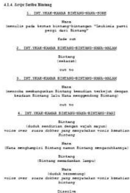
Gambar 4. Script

Pada gambar di atas merupakan scene 1 dari film Seribu Bintang. Sesuai dengan maksud dan tujuan dari perancang maka script tersebut tampak sedikit menonjolkan dialog.