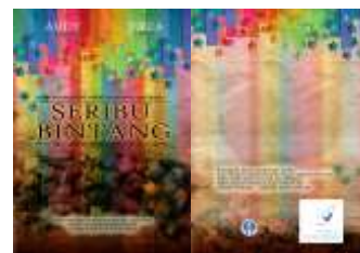
Gambar 12. Cover DVD

Cover DVD berisi judul dan gambar dari film SERIBU BINTANG tersebut. Diharapkan pada waktu kedepan DVD ini dapat dipinjam oleh instansi instansi untuk keperluan sosial dan bukan kebutuhan komersil.