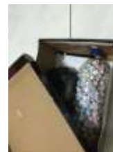
Gambar 2. Kardus