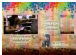
Gambar 14. Katalog

Katalog berisi pengenalan karya kepada masyarakat dan data pribadi yang dapat digunakan sebagai sumber informasi jika membutuhkan.