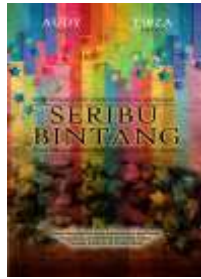
Gambar 13. Poster

Poster film berisi judul dan gambaran yang menginterpretasikan suasana dari film yang akan di angkat.