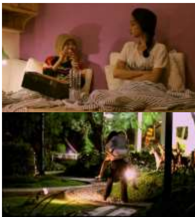
Gambar 15. Adegan Bintang dan Nana