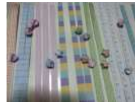
Gambar 1. botol

Properti yang digunakan dalam pembuatan film pendek untuk perancangan ini adalah kertas bintang-bintangan yang di lipat menjadi bintang-bintangan, dos sepatu untuk menyimpan bintang dan botol aqua untuk menyimpan hasil bintang.