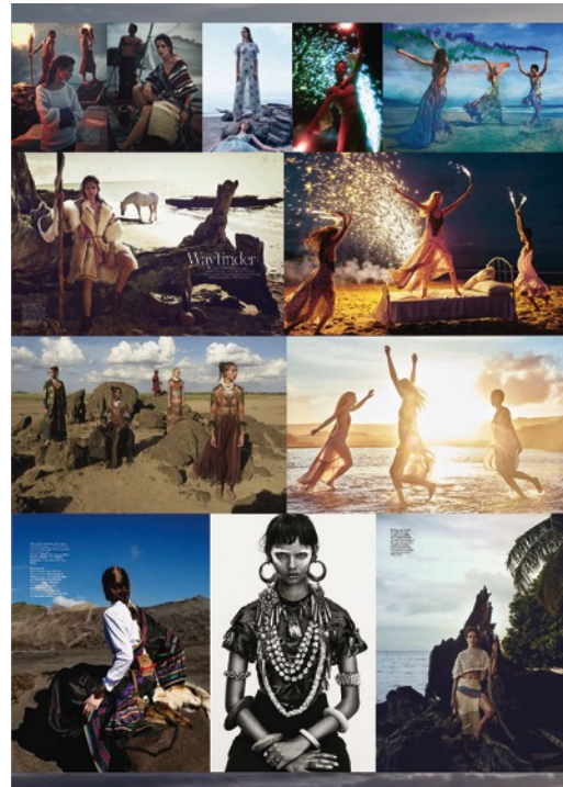
Gambar 1. Kumpulan referensi fotografi fashion .

Berikut adalah beberapa karya fotografi yang menjadi referensi :