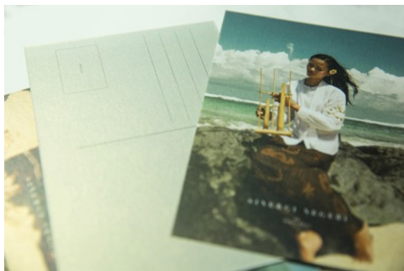
Gambar 4. Layout Postcard