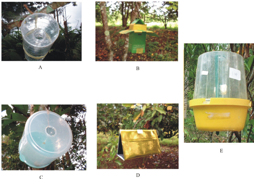
Gambar 1. Model perangkap untuk menangkap hama lalat buah yaitu (a) bekas botol air mineral, (b) modifikasi perangkap gypsy moth , (c) perangkap steiner, (d) perangkap delta transparan, (e) perangkap McPhail ( The traps type used for catching fruit flies (a) used bottle of mineral water, (b) the modified of gypsy moth trap, (c) the steiner trap, (d) transparent delta trap, and (e) McPhail trap. )

2. Penelitian tentang pengaruh ketinggian letak perangkap dilakukan di kebun Petani Kenagarian Kacang yang didominasi oleh jeruk kacang, nangka, jambu air, sawo (polikultur), dan di kebun tanaman markisa di Alahan Panjang (monokultur), Kabupaten Solok. Penelitian ditata dalam rancangan acak kelompok 6 perlakuan dan 4 ulangan. Macam perlakuan