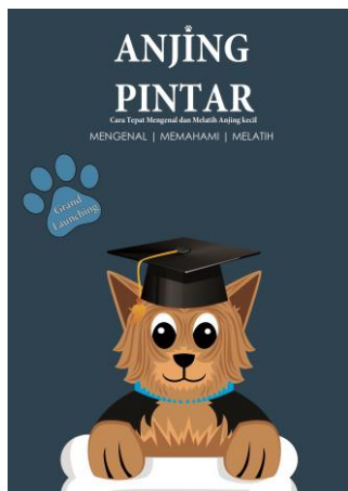
Gambar 4. Poster