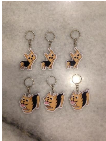
Gambar 3. Gantungan kunci