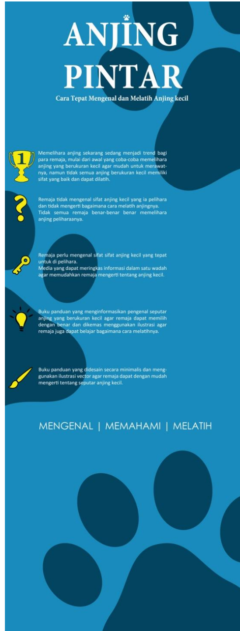
Gambar 5. X-banner