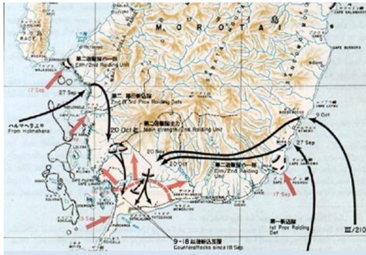
Gambar 4. Upaya Jepang dari Halmahera mendaratkan pasukannya di sisi barat dan timur pulau Morotai, 27 September-9 Oktober 1944

Sumber : Harold W. Nelson, Report of MacArthur Japanese Operations in the Southwest Pacific Area Volume II, Washington, 1994, hlm. 351