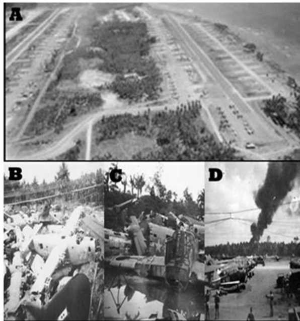
Gambar 5 : A) Kondisi Wama dan Pitoe Airdrome, April 1945