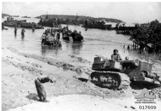
Gambar 1. Salah satu situasi pendaratan di Pantai Merah terlihat mobil Jeep dan Traktor terjebak dalam lumpur, 15 September 1944