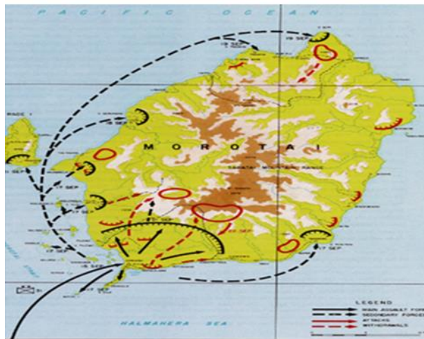
Gambar 3. Pendaratan dan Patroli Sekutu selain distrik Wajaboela, 17 September 1944