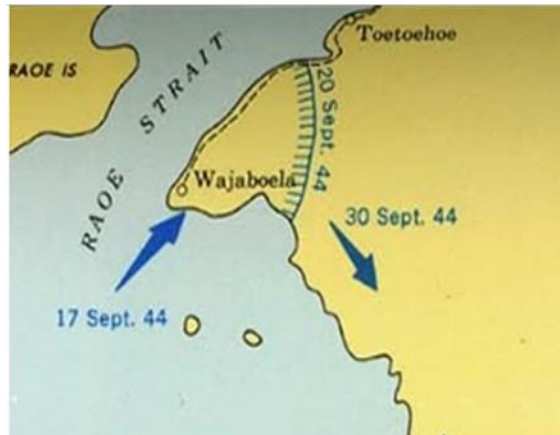
Gambar 2. Pendaratan distrik Wajaboela, 17 September 1944 dan garis parameter Sekutu tanggal 20 Oktober 1944