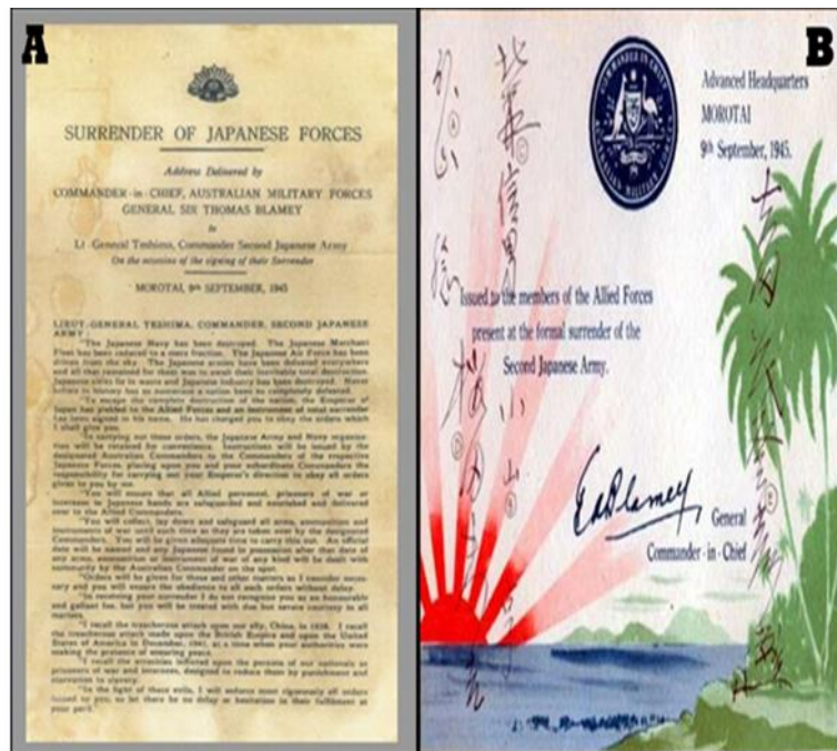
Gambar 8 : A)Dokumen pidato resmi Thomas Blamey di Morotai