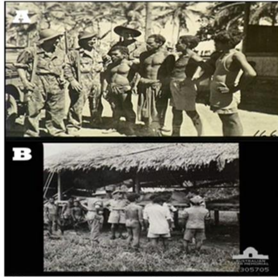
Gambar 6. Beberapa dari 350 kaum pribumi yang bekerja untuk Sekutu dalam tulisan Robert Smith, September 1944-Januari 1945

A) Sumber : http://www.awm.gov.au/collection/305705/