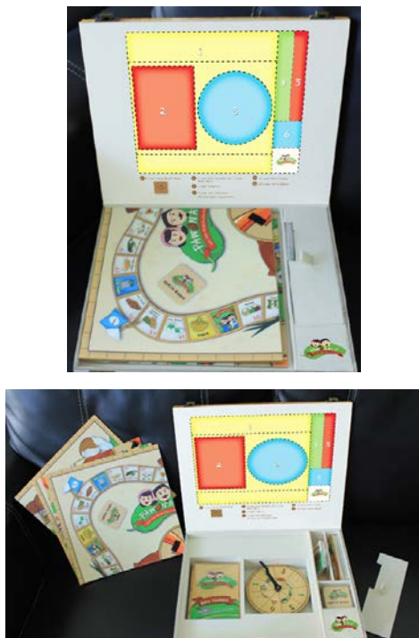
Gambar 21. Penataan komponen permainan dalam kemasan