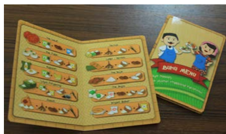
Gambar 16. Tampilan Buku Menu

Dalam permainan ini, pemain sangat membutuhkan panduan dalam menyusun komposisi jajanan tradisional dalam rupa Buku Menu. Panduan susunan komposisi ditampilkan dalam bentuk ilustrasi.