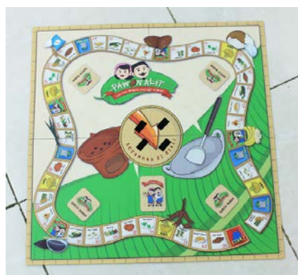
Gambar 11. Tampilan papan permainan