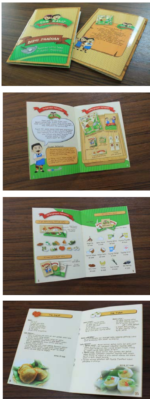
Gambar 18. Tampilan buku panduan permainan

Tujuan diberikannya resep adalah agar anak-anak dapat mengajak orang tua atau saudara untuk mencoba membuat jajanan tradisional tersebut. Tampilan foto ditujukan agar anak dapat mengetahui bentuk asli dari jajanan tradisional di samping tampilan ilustrasi yang telah dibuat.