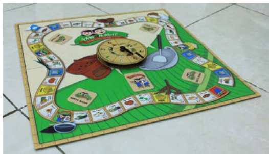
Gambar 12. Tampilan papan permainan dan roulette