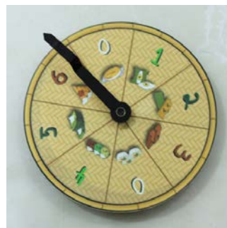
Gambar 10. Ilustrasi jajanan tradisional

Papan permainan dibuat menjadi 4 (empat) bagian puzzle . Tujuannya adalah untuk memudahkan penyimpanan dalam kemasan. Untuk ilustrasi alur dibuat melingkar karena goal dari permainan ini adalah menyelesaikan misi mengumpulkan komposisi jajanan tradisional, bukan berakhir karena pencapaian garis finish . Sehingga, dalam sekali permainan memiliki kemungkinan mencapai 2 (dua) hingga 3 (tiga) kali putaran. Untuk menuntun jalannya pion permainan digunakan roulette , sebagai pengganti fungsi dadu. Secara teknis, roulette juga berfungsi sebagai pengikat dari puzzle .