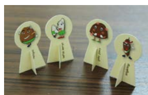
Gambar 17. Tampilan pion permainan

Pada permainan "Pawon Alit" ini, pion dibuat dalam 4 (empat) karakter yang diambil dari bahan jajanan tradisional. Karakter tersebut adalah singkong, kelapa, singkong, dan gula jawa. Pemilihan bahan yang digunakan adalah bahan yang memiliki kekhasan tertentu dalam konteks budaya Indonesia.