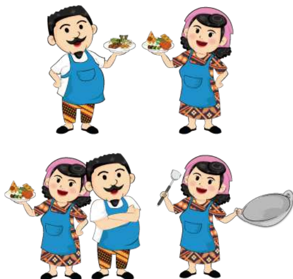
Gambar 8. Maskot permainan "Pawon Alit"

penggambaran dari pembuat jajanan tradisional. Maskot sengaja dihadirkan sepasang, yaitu bapak dan ibu. Tujuannya agar menunjukkan bahwa permainan ini dapat dimainkan oleh anak laki-laki maupun perempuan tanpa menimbulkan kesan feminim, melainkan bersifat edukatif secara menyeluruh.