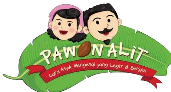
Gambar 7. Logo permainan “Pawon Alit”

Hal utama yang harus ditampilkan terlebih dahulu dalam perancangan permainan ini adalah logo produk. Sebab, melalui logo produk yang menarik dan tepat dapat menyampaikan pesan dari produk perancangan dan mampu menarik minat dari target audience . Oleh karena itu, dalam perancangan logo produk permainan “Pawon Alit” ini dibuat menarik dan mampu menggambarkan sebagai produk permainan yang terkait dengan bidang kuliner. Hal tersebut ditampilkan dari elemen yang pada logo maupun tampilan slogan yang memperjelas pesan dari produk permainan “Pawon Alit”.