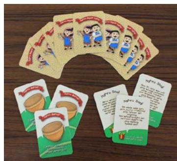
Gambar 15. Tampilan Kartu Dapur Ceria

Kartu Dapur Ceria adalah kumpulan kartu bonus yang terdiri atas 2 (dua) jenis, yaitu kartu barter dan kartu soal. Kartu barter memiliki perintah tunggal yang dibuat sebanyak 15 (lima belas) buah kartu. Sedangkan, kartu soal terdiri atas 15 (lima belas) buah kartu dengan pertanyaan yang berbeda. Dari setiap soal yang diberikan terdapat hadiah yang berhubungan dengan jalannya pion ataupun mendapatkan bonus Kartu Bahan setiap bila pemain berhasil menjawab pertanyaan tersebut dengan benar.