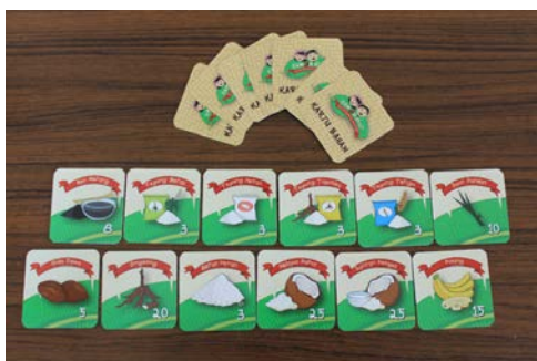
Gambar 13. Tampilan Kartu Bahan

Kartu Bahan merupakan salah satu elemen penting dalam permainan ini. Hal ini disebabkan oleh fungsi dari kartu tersebut sebagai modal untuk menyelesaikan misi mengumpulkan komposisi bahan jajanan tradisional. Pada kartu tersebut tertera angka yang merupakan nilai dari suatu bahan yang memiliki fungsi sebagai penanda kadar daya tahan bahan tersebut dan merupakan nilai yang dapat digunakan sebagai 'mata uang' dalam permainan ini.