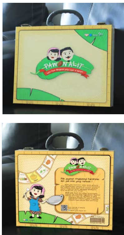
Gambar 19. Tampilan luar kemasan permainan “Pawon Alit”

Penulis ingin menampilkan permainan edukatif yang mudah untuk disimpan dan dibawa. Oleh karena itu, untuk kemasan permainan “Pawon Alit” dibentuk berupa koper yang di dalamnya memiliki partisi-partisi untuk masing-masing komponen permainan. Tujuan dari partisi-partisi tersebut adalah agar komponen permainan tampak rapi sehingga dapat diketahui dengan jelas apa saja komponen yang digunakan. Untuk memperjelas, diberikan tampilan informasi penempatan komponen permainan pada masing-masing partisi berikut dengan jumlah masing-masing komponen permainan.