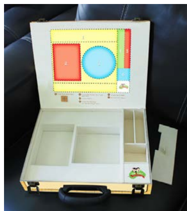
Gambar 20. Tampilan partisi kemasan permainan “Pawon Alit”