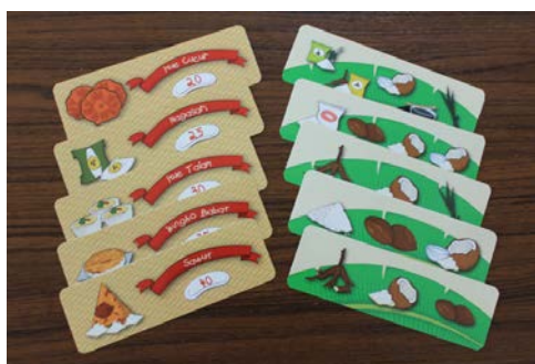
Gambar 14. Tampilan Kartu Resep

Kartu Resep merupakan kartu pendamping yang membantu pemain untuk menandai komposisi mana saja yang telah dibuat. Kartu Resep terdiri atas 10 (sepuluh) jenis jajanan tradisional. Pada kartu tersebut juga diberikan angka yang berfungsi sebagai nilai dari suatu jajanan tradisional. Nilai tersebut akan diakumulasikan pada akhir permainan untuk menentukan pemenang jika terjadi seri.