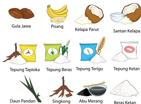
Gambar 9. Ilustrasi bahan jajanan tradisional

Adapun 10 (sepuluh) jenis jajanan tradisional yang diperkenalkan beserta 12 (dua belas) bahan jajanan tradisional. 12 (dua belas) bahan jajanan tradisional tersebut digunakan di beberapa komposisi jajanan tradisional. Ilustrasi dari jajanan tradisional dan bahan jajanan tradisional dibuat serupa dengan benda aslinya dan menampilkan apa yang menjadi ciri khas dari masing-masing benda. Tujuannya adalah agar anak dapat mengenali dengan mudah ilustrasi tersebut. Selain itu, agar tidak terjadi perbedaan yang cukup jauh antara ilustrasi dengan benda aslinya, yang mana akan menyebabkan kebingungan anak dalam mengenali jajanan tradisional maupun bahan dari jajanan tradisional.