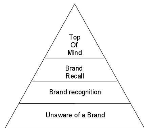
Gambar 2. Tingkatan Brand Awareness

Brand awareness ini timbul dari adanya rasa tidak asing terhadap merek. Perasaan tidak asing terhadap merek ini akan memberikan rasa percaya diri pada konsumen ketika ia menggunakan produk tersebut. Kemudian rasa percaya ini akan menyebabkan adanya perasaan bahwa resiko yang dihadapi pelanggan berkurang yang pada akhirnya akan menggiring pelanggan berkecenderungan untuk mempertimbangkan dan memilih brand yang bersangkutan. Pelaksanaan program periklanan diharapkan menimbulkan efek ( impact ) terhadap konsumen namun awareness yang tinggi ini harus diikuti oleh aksi ( action ) konsumen.