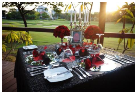
Gambar 5. Dekorasi Meja