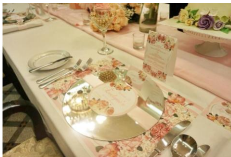
Gambar 6. Dekorasi Meja

Secara visual gaya dekorasi yang di gunakan Elite Party Designer adalah gaya dekorasi klasik modern, dapat di lihat setiap dekorasi yang di buat dengan konsep minimalis tetapi selalu menggunakan unsur bunga di dalamnya agar tetap memiliki unsur anggun dan mewah. Unsur warna yang di gunakan dalam setiap dekorasi mengikuti tema dan keinginan klien, tapi kecenderungan warna yang sering di gunakan adalah warna – warna yang terlihat soft karena terlihat lebih tenang dan feminim.