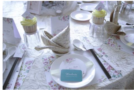
Gambar 1. Dekorasi Meja

Motto dari Wonderee Decoration adalah We make it memorable, all your needs for all kind of events. Wonderee Decoration memilih kata – kata ini sebagai motto karena ingin semua dekorasi yang di buat sebaik, seunik dan semewah mungkin ini akan dengan mudah di ingat oleh orang karena akan sangat berkesan di hati klien maupun tamu undangan dan selalu siap membantu klien apapun keinginan mereka dalam setiap acaranya. Motto ini di harapkan bisa membuat klien semakin yakin dalam menggunakan jasa Wonderee Decoration.