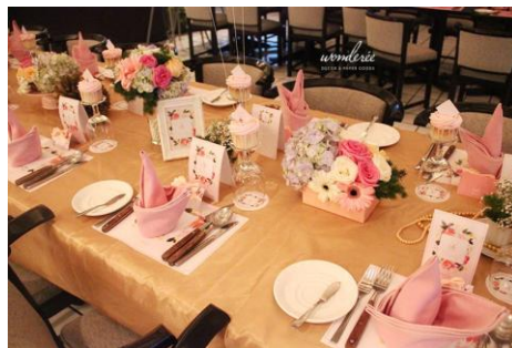
Gambar 3. Dekorasi meja

Stiefanny dan Metha bertugas di bidang marketing seperti dalam hal melayani dan meyakinkan klien untuk menggunakan jasa Wonderee Decoration, menerima dan mengatur jadwal dekorasi sehingga tidak ada yang bersamaan, mempromosikan di sosial – sosial media seperti salah satu yang sering di lakukan adalah broadcast message menginfokan tentang promo yang akan di adakan serta mengatur keuangan seperti pembayaran dari klien, uang yang harus di keluarkan untuk membeli bahan dekor dan pembagian fee.