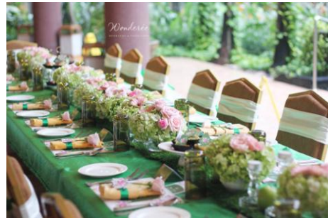
Gambar 2. Dekorasi Meja

Pengelola Wonderee Decoration sendiri adalah mereka berempat para pendirinya yaitu Metha, Devina, Josephine, dan Stiefanny karena masih terbilang baru dalam dunia dekorasi sehingga semuanya di tangani mereka sendiri dengan pembagian tugas pada masing – masingnya seperti: