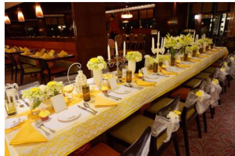
Gambar 4. Dekorasi Meja

Potensi Elite Party Designer adalah sebuah jasa dekorasi yang dapat membuat suatu acara menjadi lebih berkesan dan tidak terlupakan dengan memberikan nuansa yang elegant pada dekorasinya yang selalu berkolaborasi dengan berbagai macam bunga yang akan di sesuaikan dengan tema yang di ajukan