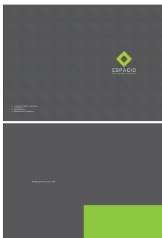
Gambar 5. Map