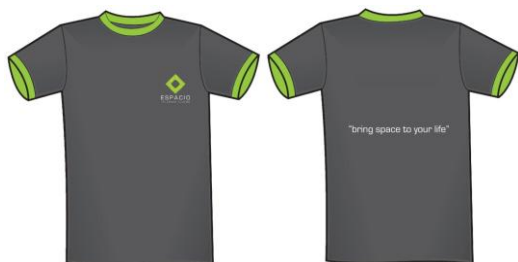
Gambar 11. Seragam Karyawan