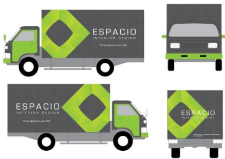
Gambar 10. Kendaraan Perusahaan