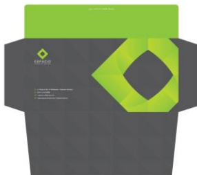
Gambar 4. Amplop