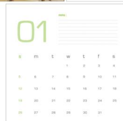
Gambar 7. Kalender