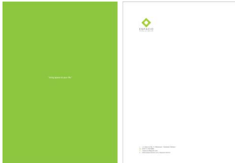
Gambar 3. Kop surat