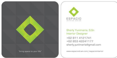
Gambar 2. Kartu nama