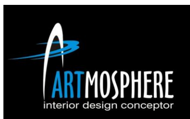
Gambar 1. Logo Artmosphere Interior Design

Espacio interior design dulunya bernama Artmosphere tetapi dikarenakan adanya masalah internal antara pemilik Artmosphere di Surabaya dan pemilik Artmosphere di Makassar maka Artmosphere di Makassar berganti nama menjadi Espacio, oleh karena itu Espacio membutuhkan corporate identity yang baru.