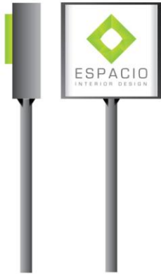
Gambar 9. Signage