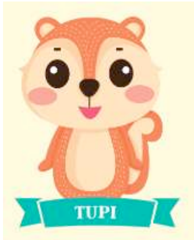
Gambar 2. Karakter Tupi