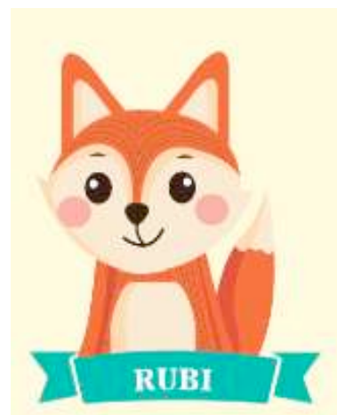
Gambar 1. Karakter Rubi