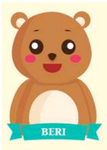
Gambar 3. Karakter Beri