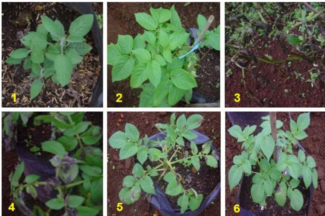
Gambar 3. Gejala serangan P. infestans pada tanaman uji umur 1 bulan setelah tanam. 1. S. bulbocastanum skor 0; 2. Transgenik Katahdin SP951 skor 1; 3. Border/Granola; 4 - 5. Granola non-transgenik; dan 6. Galur transgenik 9 skor 1.