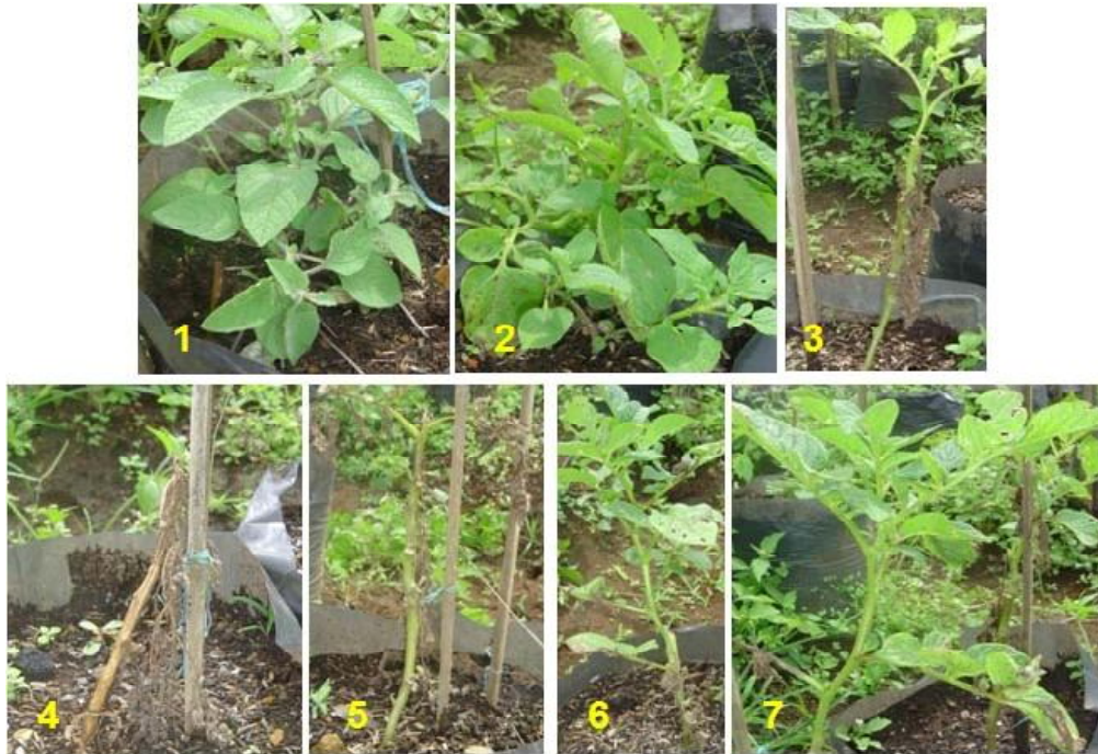
Gambar 4. Gejala serangan P. infestans pada tanaman uji (pengamatan akhir). 1. S. bulbocastanum skor 0; 2. Katahdin SP951 skor 1; 3. Granola non-transgenik skor 7; 4. Galur transgenik 2 skor 9; 5. Galur transgenik 12 skor 9; 6. Galur transgenik 6 Skor 1; dan 7. Galur transgenik 6 skor 2.