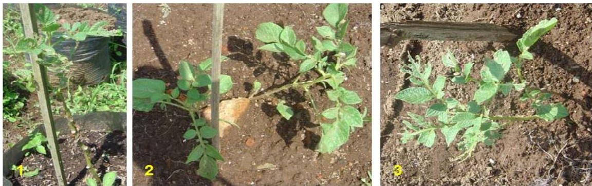
Gambar 5. Kondisi tanaman uji saat sebelum panen. 1. Galur transgenik 6; 2. Galur transgenik 24; dan 3. Galur transgenik 25.

percobaan menunjukkan angka yang memenuhi syarat yaitu 15°C (malam hari) dan 18°C (siang hari) dengan nilai RH rata-rata 89% (Anonim, 2009).