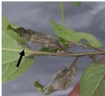
Gambar 1. Masa sporangia (tanda panah) pada daun kentang kultivar Granola non-transgenik yang terinfeksi P. infestans .

0,9 dan kontrol transgenik Katahdin SP951 dengan skor 0,45, sedangkan S. bulbocastanum PT29 menunjukkan skor 0,0. Pengamatan berikutnya semakin menunjukkan peningkatan keparahan serangan patogen. Hal ini tampak pada pengamatan kedua dan seterusnya sampai dengan pengamatan kelima yang mengindikasikan pola keparahan yang bervariasi dan sangat berbeda nyata antargalur transgenik yang diamati. Penurunan tingkat ketahanan ini didukung hasil penelitian Millett et al. (2009) yang menunjukkan bahwa semakin tua tanaman maka ekspresi gen RB menurun dan berakibat