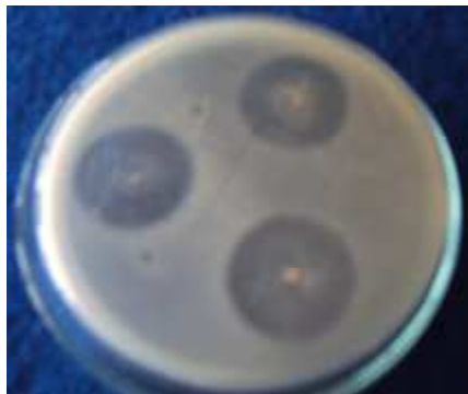
Gambar 1. Penghambatan B. subtilis B315 terhadap R. solanacearum

Angka yang diikuti oleh huruf yang sama dalam kolom yang sama menunjukkan tidak berbeda nyata pada uji Newman-Keuls 5%.