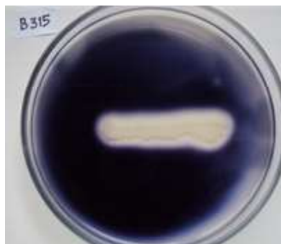
Gambar 2. Zona terang di sekitar koloni B. subtilis B315 pada uji hidrolisis pati