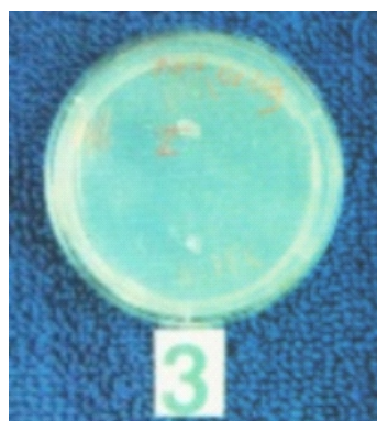
Gambar 1b. Inkompatibilitas antara isolat yang diuji dengan tester (tidak terbentuk heterocaryon ) ( Compatibility among tested isolated and tester without heterocaryon forming )