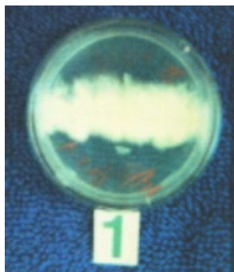
Gambar 1a. Kompatibilitas antara isolat yang diuji dengan tester diperlihatkan dengan terbentuknya koloni putih ( heterocaryon ) di areal tumbuh yang saling bersentuhan ( Compatibility among tested isolate and tester as shown by heterocaryon forming in the medium that come in touch )