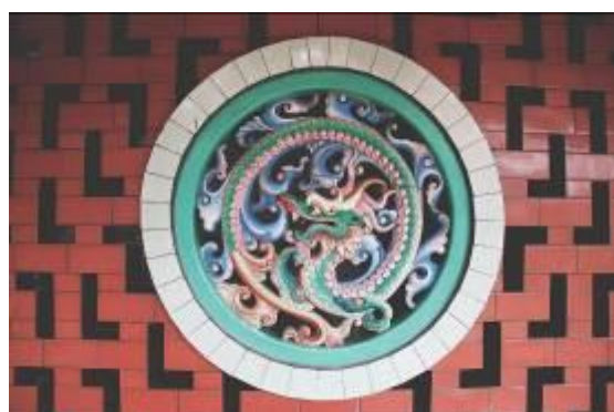
Gambar 19. Ukiran Naga