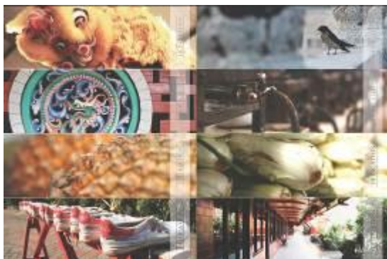
Gambar 17. Pembatas buku