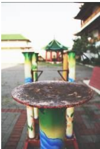
Gambar 24. Pijakan Latihan Barongsai