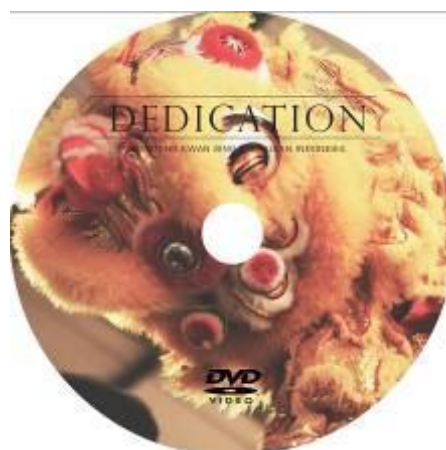
Gambar 15. Cover DVD (piringan)