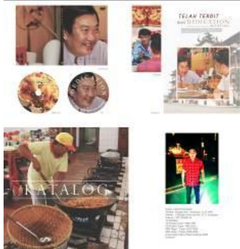
Gambar 11. Layout Katalog