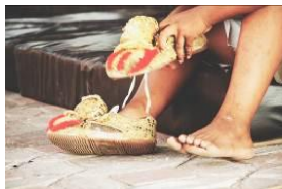
Gambar 23. Memakai Sepatu Barongsai