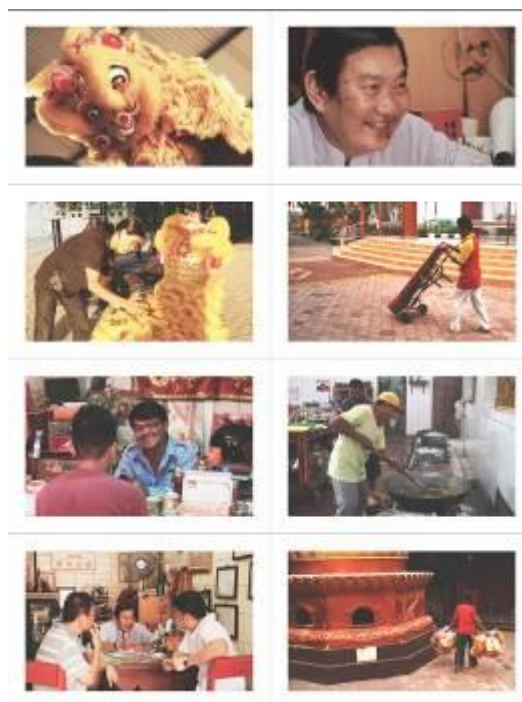
Gambar 14. Post card