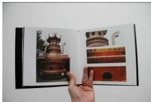
Gambar 9. Layout Buku