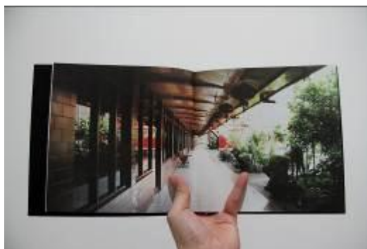
Gambar 8. Layout Buku