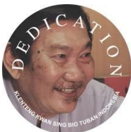
Gambar 13. Desain Pin