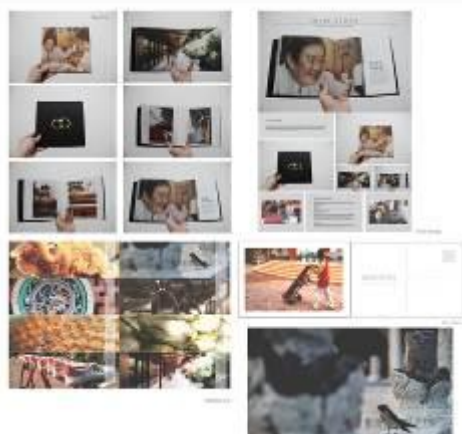
Gambar 12. Layout Katalog