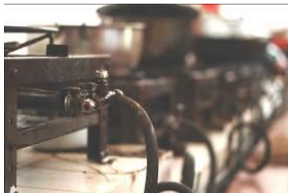
Gambar 21. Peralatan Masak