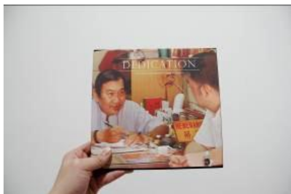
Gambar 4. Buku