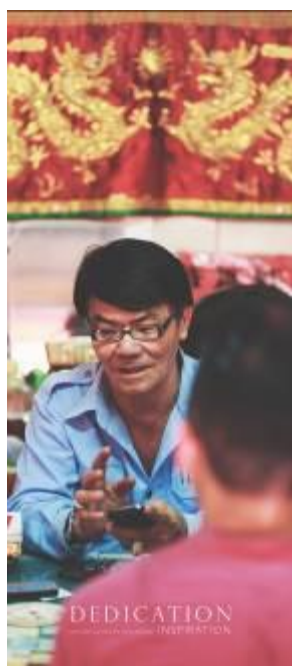
Gambar 26. X-Banner