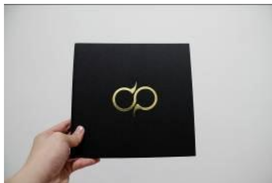
Gambar 5. Cover dalam Buku