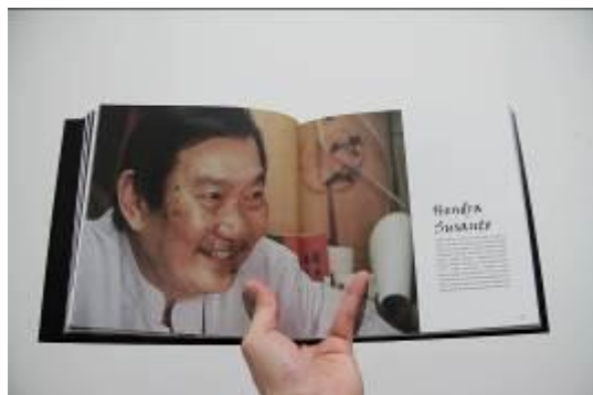
Gambar 6. Layout Buku