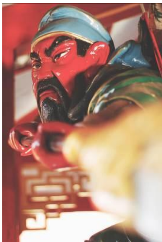
Gambar 22. Patung Kong Co