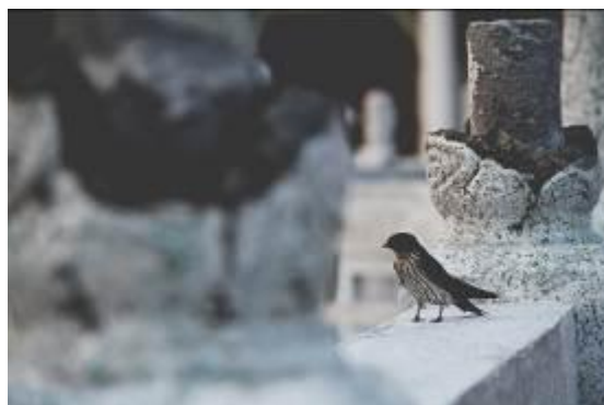
Gambar 25. Burung di bangunan Kelenteng