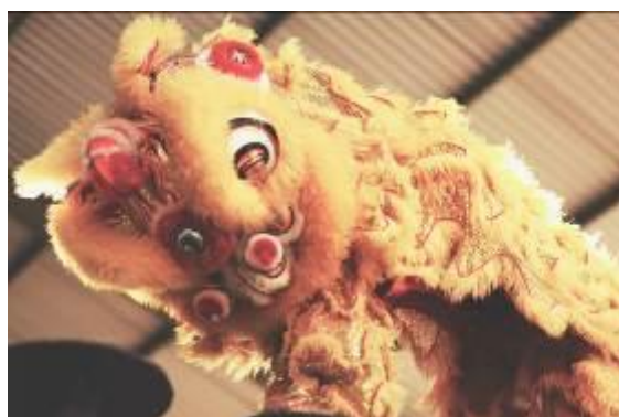
Gambar 18. Foto Barongsai