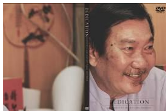
Gambar 16. Cover DVD (casing)