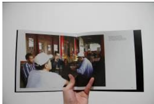
Gambar 7. Layout Buku

7. Poster; Poster yang berukuran A3 ini dibuat untuk menarik peminat buku