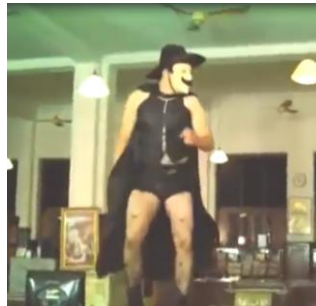
Gambar 7. penampilan dan kostum Mongol

Penampilan Mongol digambarkan seolah-olah dirinya sebagai sosok seorang zorro. Tetapi apabila pada umumnya zorro memakai pakaian hitam, berjubah hitam, bertopi hitam, bersenjata pedang anggar dari jenis rapier dan topeng hitam, maka tidak pada Mongol. Mongol memakai baju hitam tidak berlengan, celana pendek, stocking hitam bermotif bintang serta topeng berwarna krem dengan kumis hitam tebal. Baju tidak berlengan biasa digunakan oleh perempuan, celana pendek dan stocking pun juga biasa digunakan oleh perempuan, hal ini menggambarkan bahwa Mongol cenderung menyukai cara berpakaian seperti perempuan pada umumnya.