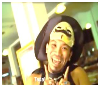
Gambar 8. gambar ini diambil secara dutch angel

Pengambilan gambar secara Dutch angel yang terjadi dalam scene ini menggambarkan ekspresi raut wajah gembira Mongol secara jelas kepada penonton. Pada scene ini diceritakan kemunculan Mongol ketika akan memperkenalkan dirinya dihadapan teman-temannya.