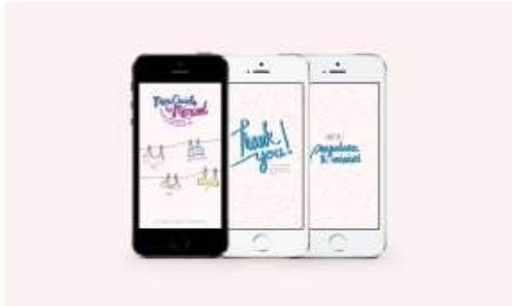
Gambar 28. Aplikasi e-book bagi anak di iphone