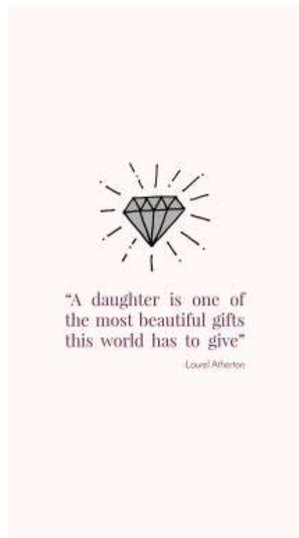
Gambar 18. Halaman kedua

Pada halaman ini diberi quotes untuk mengingatkan kembali kepada orang tua bahwa anak mereka sangat berharga