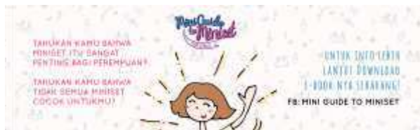
Gambar . Web Banner

Buku dapat diakses melalui smartphone kapan saja dan dimana saja