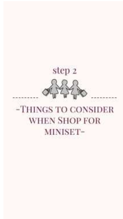
Gambar 22. Halaman kesebelas