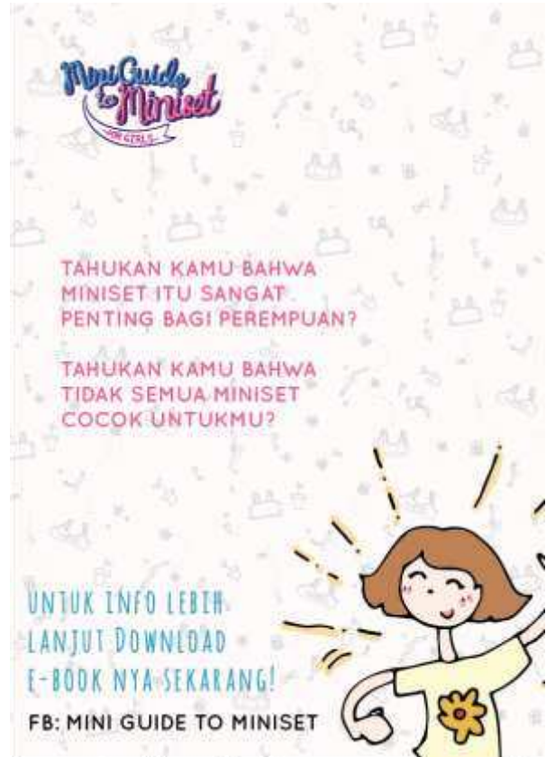
Gambar 31. Poster Promosi

Banner ini akan di pasang pada situs yang sering diakses anak dan orang tua seperti detik health dan facebook