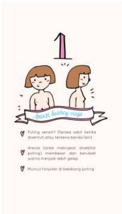
Gambar 17. Chapter 3 halaman keempat

Pada halaman ini pembaca diberitahu bahwa ada 3 tahap pertumbuhan payudara dan dibutuhkan miniset yang berbeda di tiap tahap.