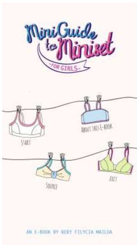
Gambar 13. Halaman menu

Halaman ini merupakan halaman menu yang nantinya akan dilihat pertama kali oleh pembaca, di halaman ini pembaca dapat mulai membaca dari awal, atau membaca halaman terakhir yang ingin dia baca, lalu dapat pula melihat sumber, dan juga menutup aplikasi.