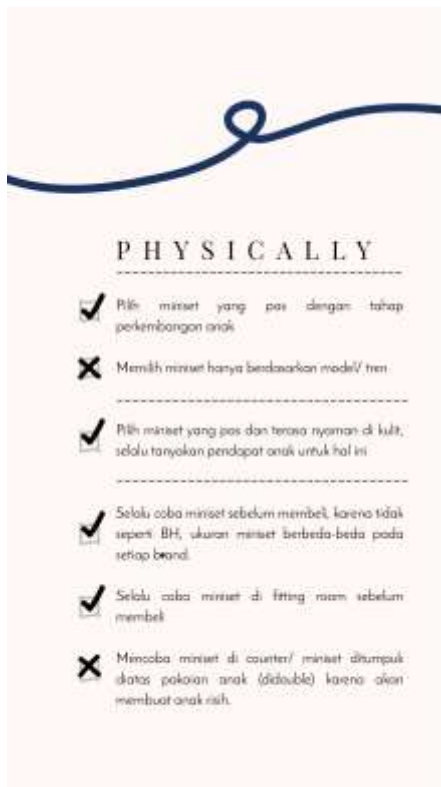
Gambar 24. Halaman ketiga belas

Menjelaskan tentang hal yang boleh dan tidak boleh dilakukan ketika berbelanja miniset dengan anak dari segi fisik.