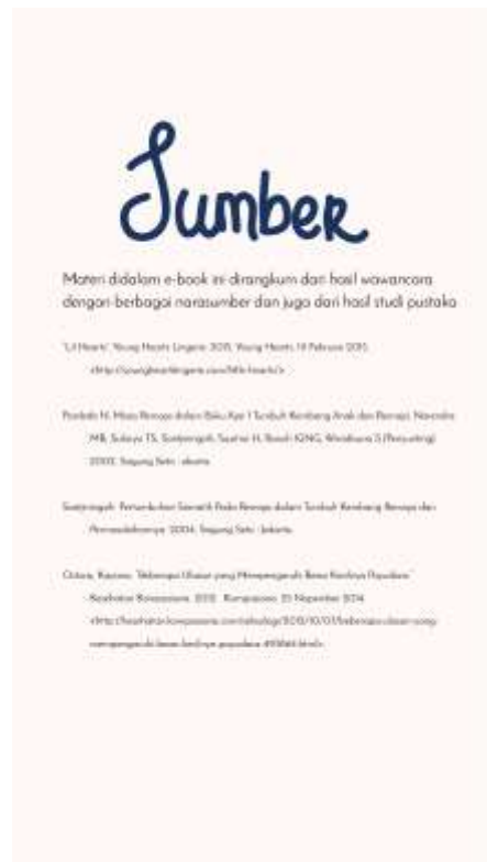
Gambar 27. Halaman kedelapan belas

Pada halaman ini menjelaskan tentang bahan-bahan yang terkandung dalam miniset .