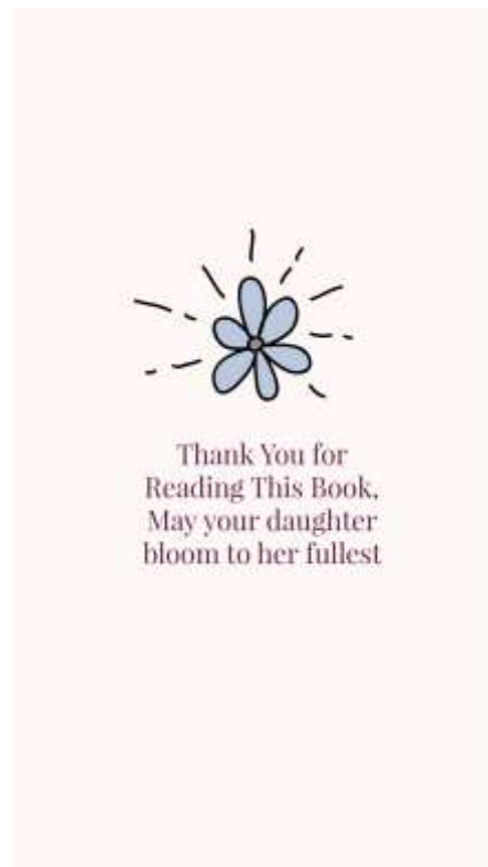
Gambar 26. Halaman ketujuh belas

Menjelaskan tentang hal yang boleh dan tidak boleh dilakukan ketika berbelanja miniset dengan anak dari segi fisik.