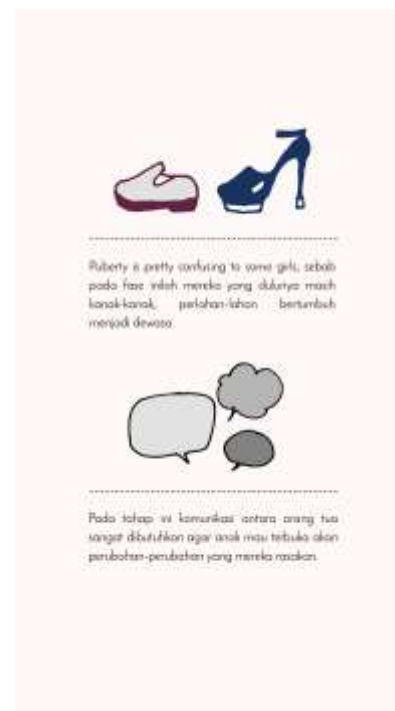
Gambar 19. Halaman ketiga

Pada halaman ini diberi quotes untuk mengingatkan kembali kepada orang tua bahwa anak mereka sangat berharga