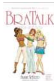
Gambar 2. Cover The Bra Talk

Buku dengan bahas yang ringan seperti ketika wanita sedang berdiskusi satu sama lain. Buku ini menjelaskan tentang pentingnya bra dan cara memilih bra yang baik.