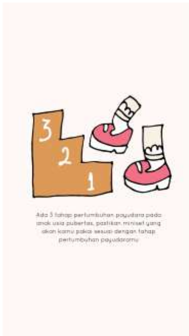
Gambar 16. Chapter 3 halaman ketiga

Pada halaman ini dijelaskan fungsi-fungsi miniset . Pada tahap ini pula secara tidak langsung anak dapat mengerti akibat jika tidak menggunakan miniset