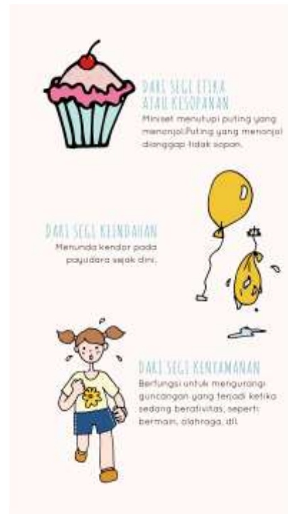
Gambar 15. Chapter 2 halaman keempat

Pada halaman ini dijelaskan bahwa untuk melindungi payudara sejak dini dibutuhkan miniset