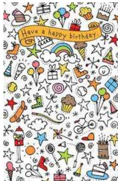
Gambar 11. Referensi ilustrasi II