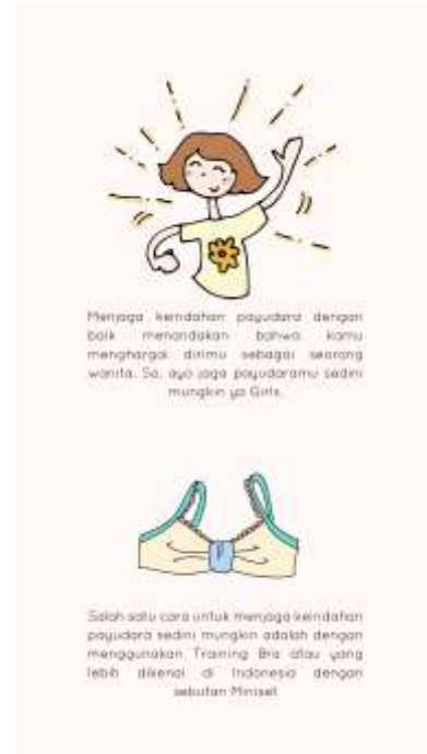
Gambar 14. Chapter 2 halaman kedua

Halaman ini merupakan halaman menu yang nantinya akan dilihat pertama kali oleh pembaca, di halaman ini pembaca dapat mulai membaca dari awal, atau membaca halaman terakhir yang ingin dia baca, lalu dapat pula melihat sumber, dan juga menutup aplikasi.