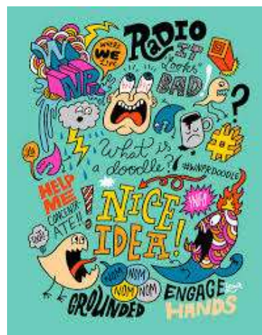
Gambar 12. Referensi ilustrasi III