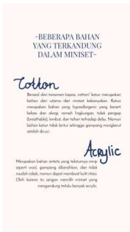
Gambar 25. Halaman kelima belas

Halaman penutup berisi harapan agar anak dapat bertumbuh dengan maksimal