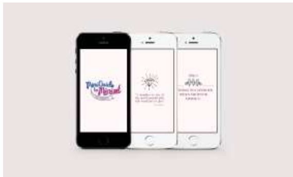
Gambar 29. Aplikasi e-book bagi orang tua di iphone

Buku dapat diakses melalui smartphone kapan saja dan dimana saja