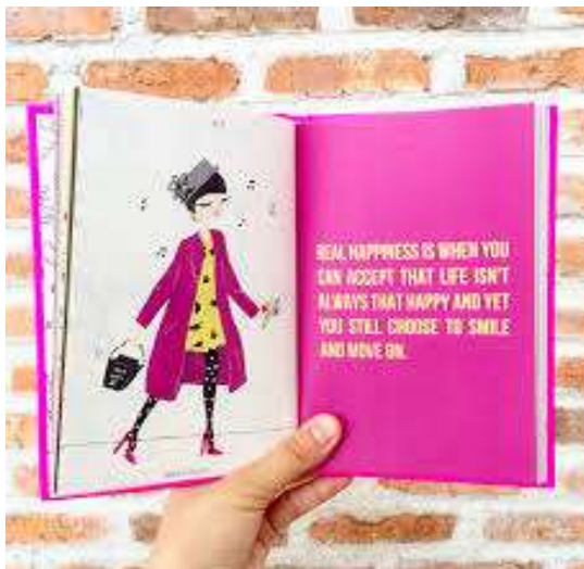
Gambar 10. Referensi ilustrasi I