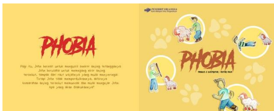
Gambar 1. Cover Buku Ilustrasi