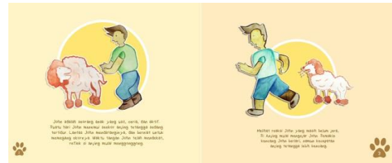
Gambar 2. Isi Buku Ilustrasi