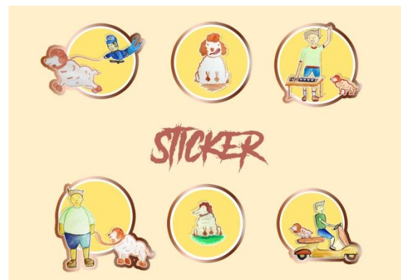
Gambar 5. Desain Sticker