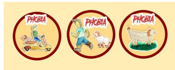
Gambar 4. Desain Pin