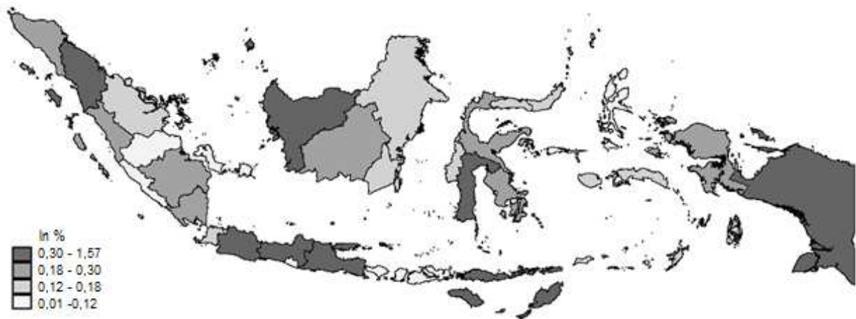
Gambar 2: Peta Penyebaran OOSC di Indonesia Tahun 2012