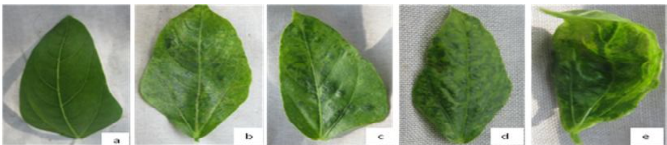
Gambar 1. Skala untuk keparahan penyakit. (a) Skor 0 (tanaman tidak menunjukkan gejala), (b) skor 1 (gejala mosaik ringan disertai pemucatan tulang daun), (c) skor 2 (gejala mosaik sedang), (d) skor 3 (gejala mosaik berat), dan (e) skor 4 (gejala mosaik berat dengan malformasi daun yang parah, kerdil, atau mati).

Untuk mengetahui perlakuan kitosan menginduksi ketahanan sistemik tanaman atau tidak, dilakukan pengukuran aktivitas enzim peroksidase. Sumber enzim