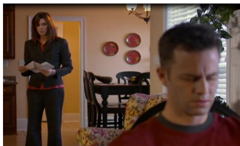
Gambar 2. Catherine sudah menghubungi pengacara dan menyangkut soal pembagian uang