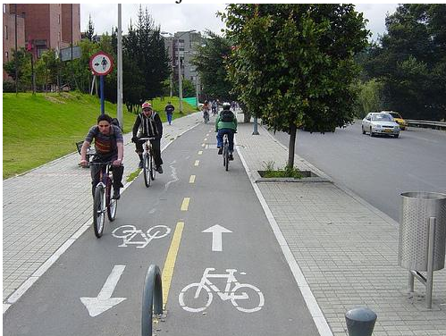
Gambar 1. Bike Path