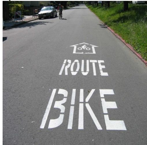
Gambar 3. Bike Route

Objek dari penelitian Pembuatan Jalur Kondusif Bersepeda Kota Semarang ini adalah bike lane yaitu jalur sepeda sebagai bagian jalur lalu lintas yang hanya dipisah dengan marka jalan atau warna jalan yang berbeda. Hal itu dikarenakan di kota Semarang hanya terdapat bike lane yang digunakan sebagai jalur untuk bersepeda.