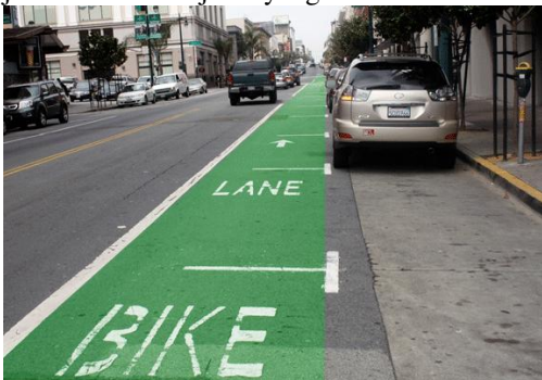
Gambar 2. Bike Lane