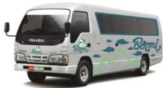
Gambar 19. Branding mobil angkutan