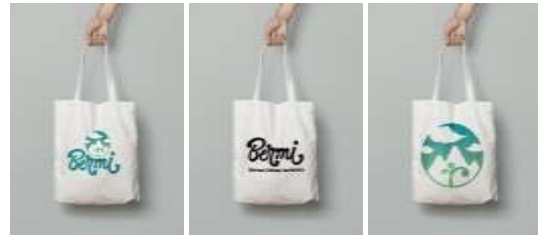
Gambar 12. Totebag