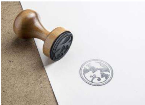
Gambar 23. Stempel