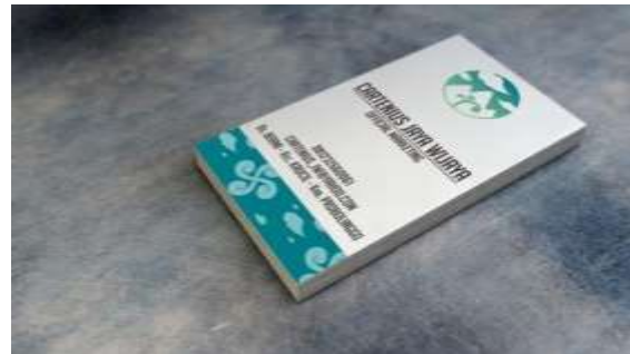
Gambar 13. Kartu nama