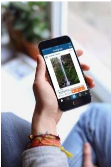
Gambar 17. Instagram