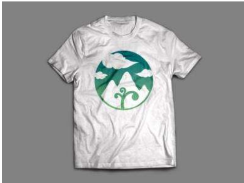
Gambar 24. Kaos