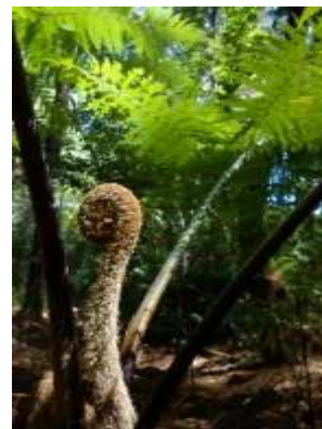
Gambar 3. Ikon tanaman pakis

Unsur ikonik yang akan digunakan dalam proses perancangan destination branding desa wisata Bermi adalah dengan menggunakan beberapa komponen yang cukup banyak ditemui di desa Bermi seperti pohon, aliran air, atau unsur susu sapi. Penggunaan elemen tersebut bertujuan untuk menggambarkan citra desa Bermi melalui komponen yang cukup dominan di desa Bermi