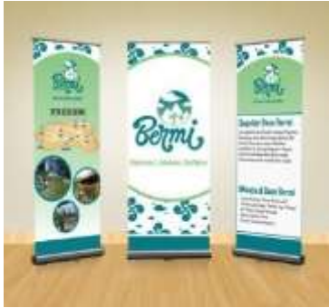
Gambar 15. X-Banner