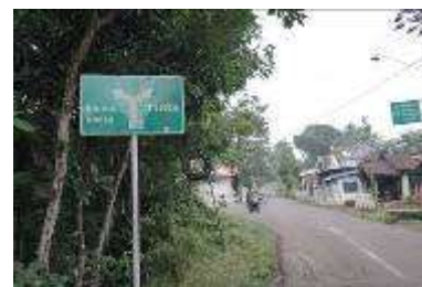
Gambar 1. Papan petunjuk menuju Desa Bermi

Nama : Desa Bermi Lokasi : Desa Bermi, Kecamatan Krucil Kabupaten Probolinggo