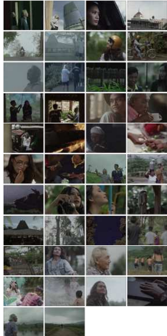
Gambar 26. Screenshoot video iklan