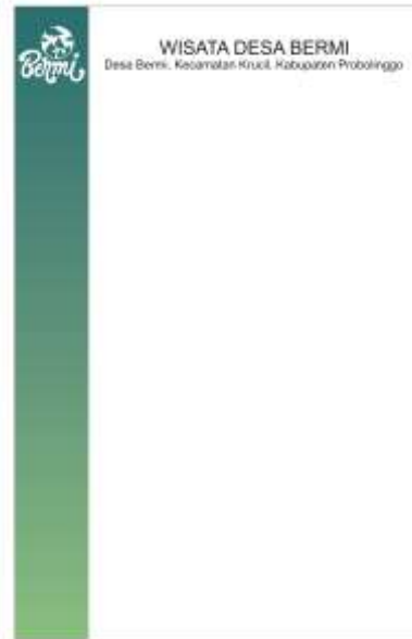
Gambar 18. Kop Surat