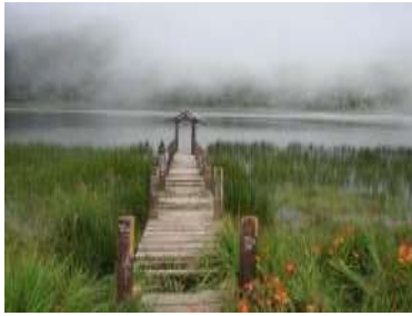
Gambar 4. Danau taman hidup