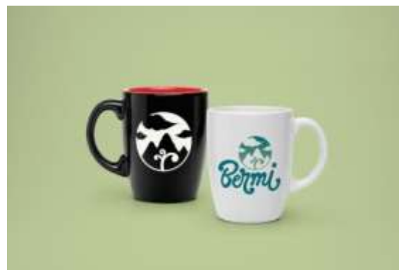
Gambar 20. Mug