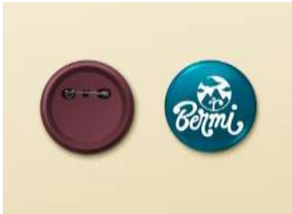
Gambar 22. Pin