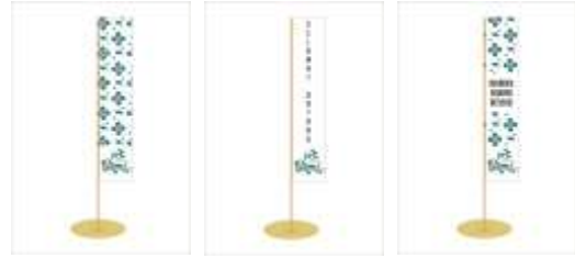
Gambar 11. Bendera umbul-umbul

Media yang digunakan dalam proses perancangan destination branding ini terdiri dari media ATL (Above The Line), BTL (Below The Line), serta media lain yang mendukung branding dari Desa Bermi seperti : Logo, Media sosial, serta berbagai media untuk kepentingan merchandise, stationary, serta promosi.