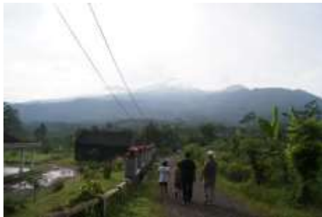
Gambar 5. Gunung Argopuro