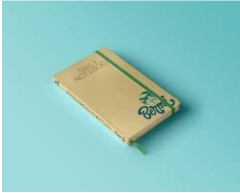
Gambar 21. Notes