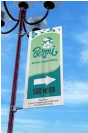
Gambar 16. Papan penunjuk jalan