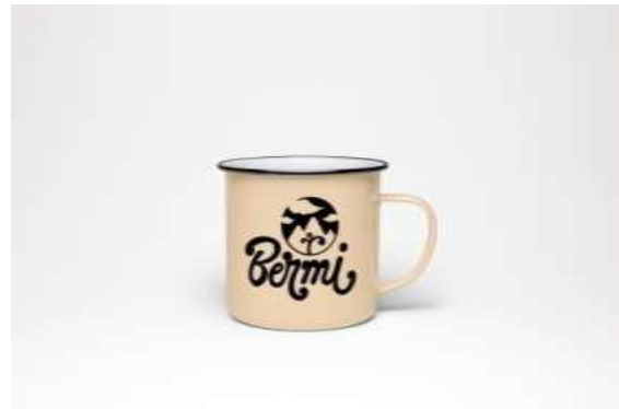
Gambar 14. Mug Mini