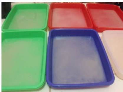
Gambar 1. Lapisan Pelikel Selulosa Hasil Fermentasi

penambahan 1,4-butanadiol dan PEG 1000 dengan konsentrasi 0,5% dan 1,0%. Dalam penelitian ini, penggunaan butanadiol dan PEG 1000 dengan konsentrasi di atas 1,0% mengakibatkan tidak terbentuknya lapisan pelikel bioplastik, hal ini karena aktivitas Acetobacter xylinum terganggu jika konsentrasi bahan pemlastis tersebut terlalu tinggi.