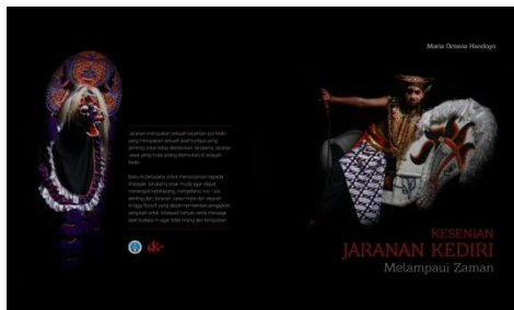
Gambar 2. Cover buku depan dan belakang Layout Isi Buku