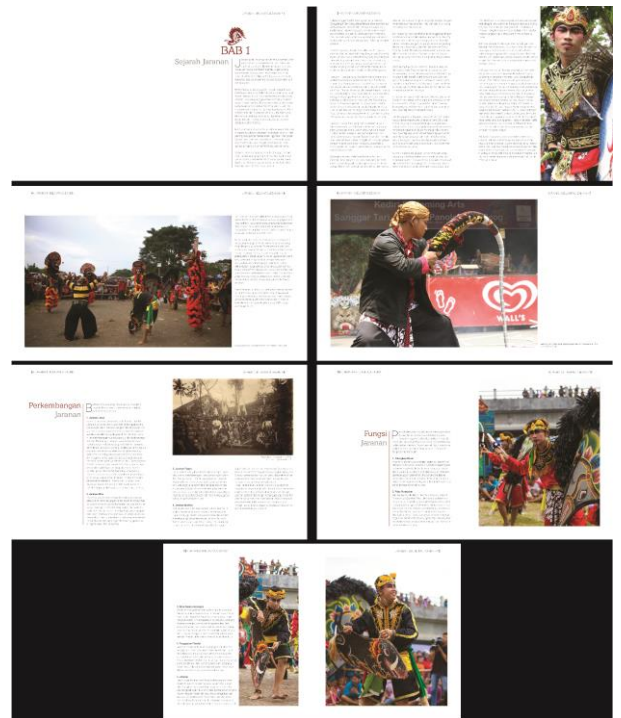
Gambar 3. Layout