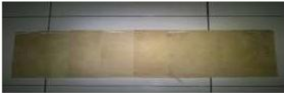
GAMBAR 2. Hasil pewarnaan pada kain

sehingga warna dari pigmen kunyit tertutupi pigmen dari pelepah getah pelepah pisang kepok (Jahanshaei & Tabarsa 2012, Sa'adah 2010), untuk menghasilkan nilai kelunturan yang rendah dan warna yang maksimal maka digunakan nilai perbandingan volume getah pelepah pisang sebesar 40%.