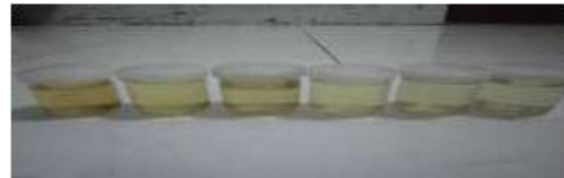
GAMBAR 4. Hasil perendaman air sabun

sabun dengan perbandingan volume yang semakin meningkat, nilai transmitansi yang di hasilkan semakin besar pula. Sehingga semakin banyak pemberian getah pelepah pisang kepok terhadap pigmen alami kunyit nilai transmitansi mengalami peningkatan yang artinya nilai kelunturan semakin berkurang, hal ini di tunjukan oleh Gambar 3 dan Gambar 4.