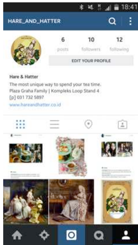
Gambar 6. Instagram

Social media yang dipakai adalah instagram dengan cara meng- upload seputar menu afternoon tea dan me- repost testimonial dari beberapa customer yang menikmati menu afternoon tea di Hare and Hatter. Akun akan di update dengan jangka waktu tertentu dan secara long life span . Akun Instagram akan mulai tayang pada bulan Juli 2014, dengan username : hare_and_hatter .