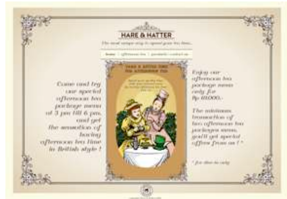
Gambar 2. Website

Pada masa kini telah berkembang dunia internet yang memudahkan untuk mengakses berbagai informasi dimanapun dan kapanpun orang berada. Tujuan yang ingin dicapai adalah agar masyarakat dapat melihat berbagai informasi mengenai produk yang ditawarkan Hare and Hatter dengan mengaksesnya secara online. Website milik Café Hare and Hatter berisi tentang berbagai promo menu produk yang ditawarkan, spesifikasi dan value produk menu afternoon tea dan menu lainnya. Website akan mulai tayang pada bulan Juli 2014. Alamat website Hare and Hatter adalah www.hareandhatter.co.id .