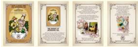
Gambar 4. Brosur

Brosur Café Hare and Hatter akan dibuat dengan ukuran standart yaitu ukuran A5 (10,5 cm x 14,8 cm) yang akan dicetak sebanyak 20 rim yaitu 10 ribu lembar. Pada brosur akan terdapat potongan kupon penukaran souvenir untuk 100 pengunjung pertama. Brosur akan dibagikan di kompleks Ruko Plaza Graha Family, yang merupakan kawasan ruko perkantoran, pertokoan, dan sekolah.