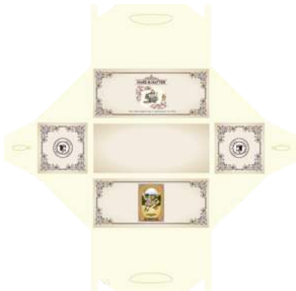
Gambar 8. Kemasan

Produk menu afternoon tea package selain dapat dinikmati secara dine-in , juga dapat di- take away oleh customer. Kemasan digunakan untuk mempercantik produk yang nantinya dapat digunakan sebagai pemberian terhadap kerabat. Sehingga media kemasan yang sesuai dengan tujuan promosi dibutuhkan dan dapat menjadi prestise bagi orang yang membawanya. Kemasan akan mulai digunakan mulai dengan Juli 2014.