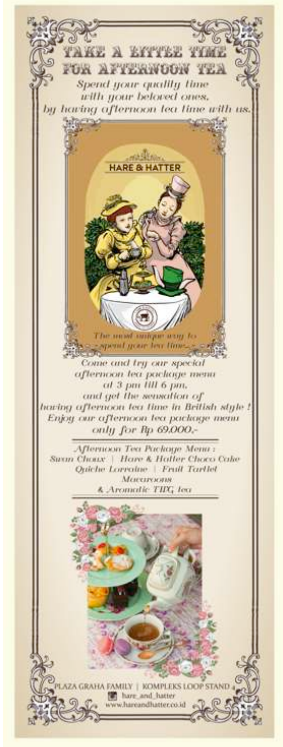
Gambar 1. X – Banner

Pada masa kini telah berkembang dunia internet yang memudahkan untuk mengakses berbagai informasi dimanapun dan kapanpun orang berada. Tujuan yang ingin dicapai adalah agar masyarakat dapat melihat berbagai informasi mengenai produk yang ditawarkan Hare and Hatter dengan mengaksesnya secara online. Website milik Café Hare and Hatter berisi tentang berbagai promo menu produk yang ditawarkan, spesifikasi dan value produk menu afternoon tea dan menu lainnya. Website akan mulai tayang pada bulan Juli 2014. Alamat website Hare and Hatter adalah www.hareandhatter.co.id .