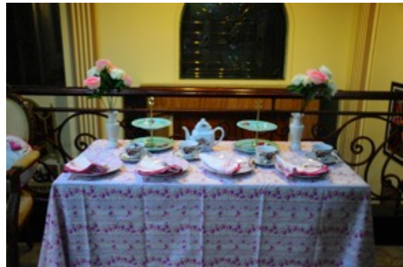
Gambar 9. Table setting

Table setting akan diatur sedemikian rupa dan disusun saat teknis penyediaan menu afternoon tea , mulai dari pukul tiga hingga enam sore dan dimulai pada bulan Juli 2014.