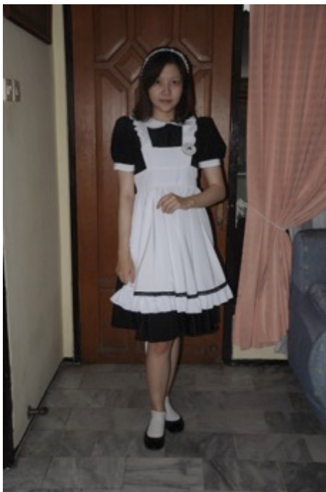
Gambar 12. Seragam waitress English Maid

Seragam waitress ini dipilih untuk dipakai oleh para pramusaji di Café Hare and Hatter ketika melayani customer dan dalam menyajikan menu afternoon tea . Seragam dibuat dengan model dan bentuk yang menyerupai English Maid pada jaman Victorian era, sehingga memperkuat citra dan atmosfer pelayanan penyajian menu afternoon tea seperti di Inggris. Seragam akan dibuat sebanyak 5 buah sesuai dengan pramusaji yang dimiliki oleh Café Hare and Hatter. Pemakaian seragam adalah pukul tiga hingga enam sore saat jam afternoon tea time . Seragam akan mulai digunakan pada bulan Juli 2014, dengan disematkan pin logo Hare and Hatter.