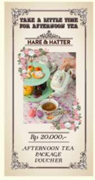
Gambar 13. Voucher potongan harga sisi depan

Voucher potongan harga akan mulai diberikan pada bulan Juli 2014 dengan minimum transaksi pembelian 2 packages afternoon tea menu dengan potongan