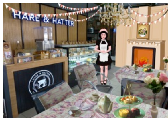
Gambar 10. Tema dekorasi reguler

Tema dekorasi akan diatur sedemikian rupa pada setiap harinya. Tema dekorasi reguler akan disusun mulai bulan Juli 2014 hingga November 2014, sedangkan tema dekorasi untuk menyambut hari Natal akan mulai disusun pada bulan Desember 2014.