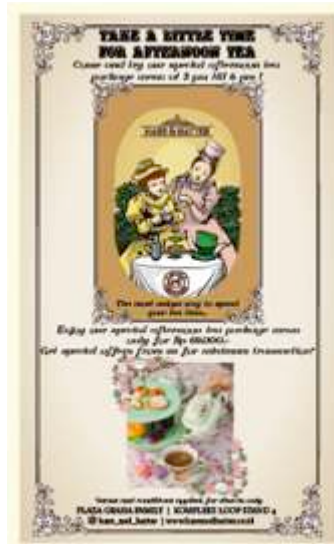
Gambar 3. Iklan surat kabar

Iklan promosi menu afternoon tea package Hare and Hatter akan ditempatkan pada surat kabar yang memiliki jangkauan lokal Surabaya, Jawa Timur, yaitu Jawa Pos di segmen Metropolis. Jawa Pos adalah koran Surabaya yang banyak diminati oleh masyarakat. Jawa Pos juga mempunyai jangkauan target audience yang paling luas dan mencakup segala golongan masyarakat. Iklan surat kabar ini akan dipasang selama satu bulan satu kali selama enam bulan dari bulan Juli 2014 – Desember 2014.