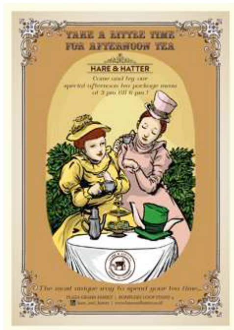
Gambar 5. Poster

Karena target audience dari Café Hare and Hatter yang sebagian besar adalah berprofesi sebagai pelajar, poster dipasang di berbagai papan pengumuman di beberapa universitas di Surabaya. Dibuat dengan ukuran kertas A3 yaitu 42 cm x 33 cm.