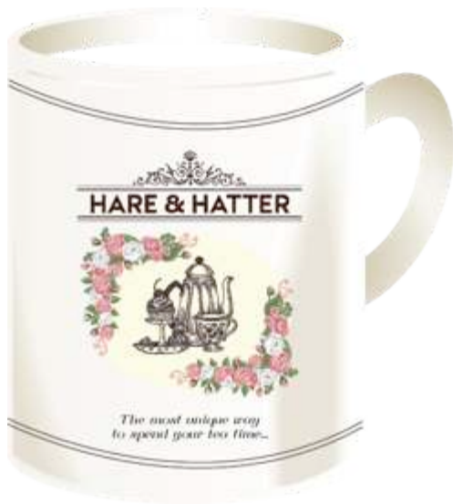
Gambar 7. Merchandise Mug

Produk menu afternoon tea package selain dapat dinikmati secara dine-in , juga dapat di- take away oleh customer. Kemasan digunakan untuk mempercantik produk yang nantinya dapat digunakan sebagai pemberian terhadap kerabat. Sehingga media kemasan yang sesuai dengan tujuan promosi dibutuhkan dan dapat menjadi prestise bagi orang yang membawanya. Kemasan akan mulai digunakan mulai dengan Juli 2014.