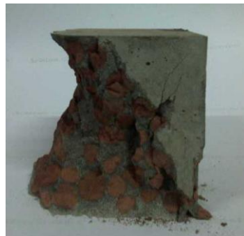
Gambar 3. Beton dari Agregat Ringan Geopolimer, Sebelum dan Sesudah Uji Kuat Tekan

Dari kedua tabel diatas dapat dilihat bahwa beton ringan berbahan agregat ringan geopolimer memiliki berat jenis yang lebih ringan daripada beton konvensional. Tetapi masih belum memenuhi syarat beton ringan di Indonesia (SNI 03-3449-2002), yaitu beton dengan berat jenis maksimum 1.85 g/cm 3 dengan kekuatan tekan minimum 17.24 MPa