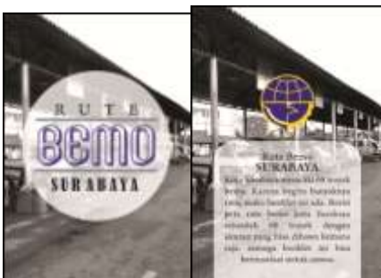
Gambar 2. Sampul Depan dan Sampul Belakang booklet

Berikut merupakan aplikasi desain pada media utama dan media pendukung