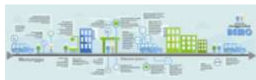
Gambar 5. Infografis