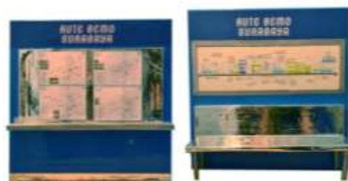
Gambar 4. Point of purchase