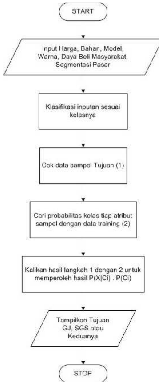
Gambar 4. Flowchart Perhitungan Metode Naïve Bayes

Proses di atas merupakan perhitungan metode Naïve Bayes dalam mencari nilai probabilitas dari setiap atribut yang sudah ditentukan untuk mendapatkan probabilitas dari atribut Tujuan sebagai proses penempatan barang saniter.