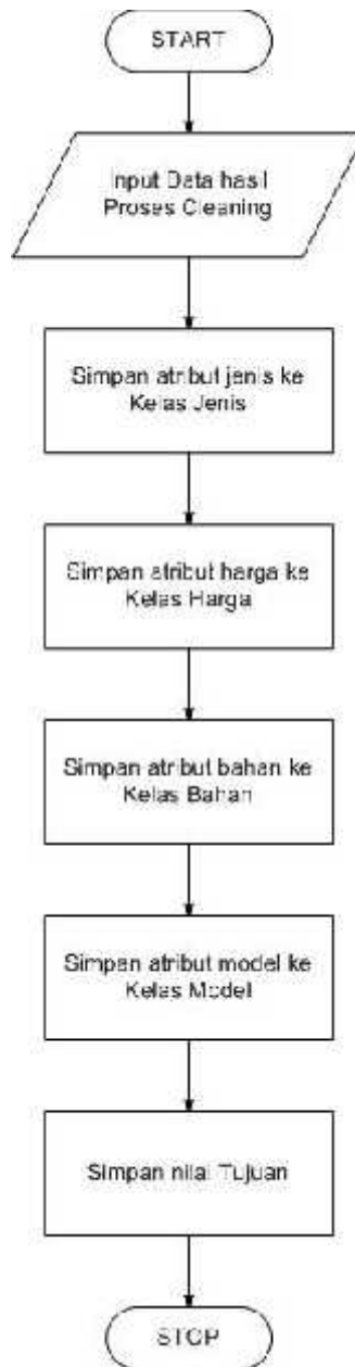
Gambar 3. Flowchart Proses Data Training

Proses Data Training yang merupakan proses penyimpanan atribut-atribut yang telah ditentukan ke dalam kelasnya masing-masing sebagai klasifikasi.