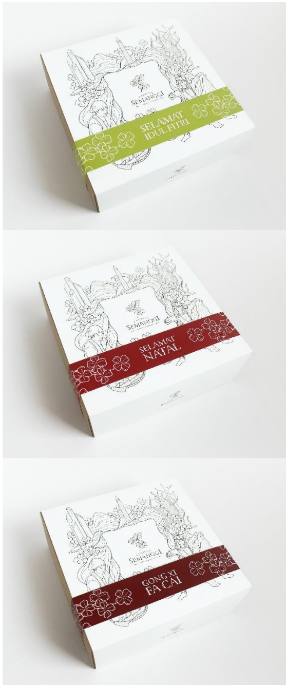
Gambar 15. Kemasan paket semanggi instan seasonal hari raya Idul Fitri , Natal dan Imlek