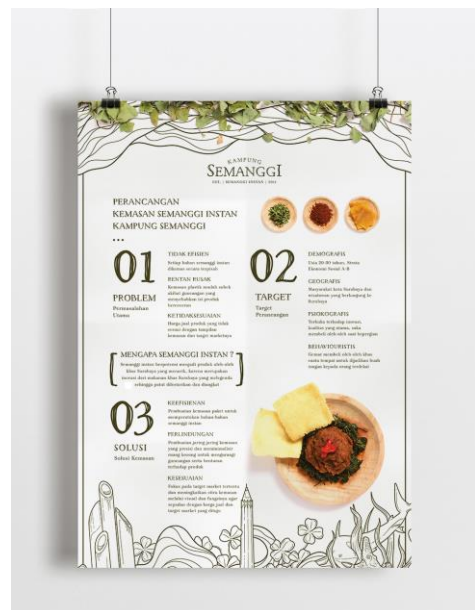
Gambar 26. Poster konsep