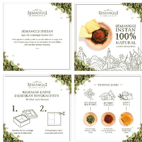
Gambar 22. Media sosial