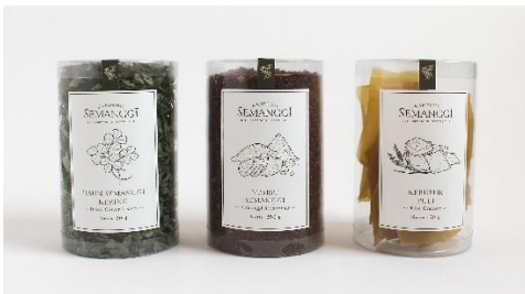
Gambar 8. Kemasan primer bahan-bahan semanggi instan

Kemasan primer terletak di dalam kemasan sekunder. Kemasan primer yang digunakan untuk kemasan semanggi instan ini adalah tabung mika. Terdapat dua tipe kemasan yang dibuat untuk kemasan semanggi instan ini, yakni kemasan bahan-bahan semanggi instan yang dijual terpisah dan satu paket bahan-bahan semanggi instan yang dikemas menjadi satu. Kemasan primer tabung tersebut akan diberi label yang memuat informasi mengenai logo Kampung Semanggi, jenis bahan, komposisi, tanggal kadaluarsa dan berat bersih.