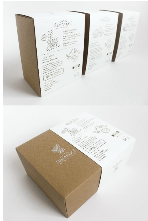
Gambar 12. Kemasan sekunder bahan-bahan semangi instan bagian belakang