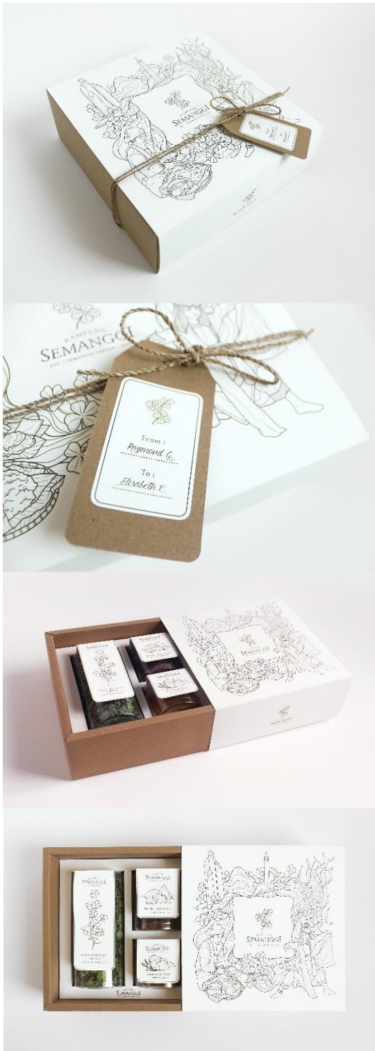
Gambar 11. Kemasan sekunder paket semangi instan