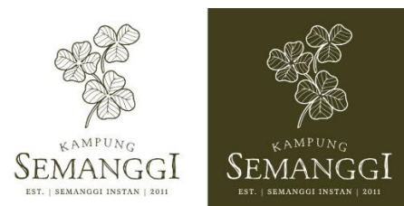
Gambar 5. Final logo aplikasi 1

Melalui hasil observasi dan penggalan data yang telah dilakukan, dibuatlah sebuah desain logo untuk mencerminkan brand dan identitas semanggi instan merek Kampung Semanggi yang baru. Logo Kampung Semanggi terdiri atas dua bagian logo, yakni logogram dan logotype yang keduanya dapat digunakan secara terpisah maupun menjadi satu kesatuan logo. Logo tersebut didesain menggunakan satu warna utama, yakni hijau dan putih. Warna hijau dipilih karena mencerminkan warna dari produk yakni daun semanggi yang didominasi oleh warna hijau. Selain itu, warna hijau dipilih untuk membangkitkan kesan alami dan natural serta sehat pada produk semanggi instan. Pada logotype , pemilihan font pada logo menggunakan dua jenis font yang berbeda antara lain serif dan sketchy dekoratif. Font sketchy dekoratif digunakan pada tulisan Kampung Semanggi sebagai merek dari produk semanggi instan, sedangkan, font serif digunakan untuk sub brand dengan ukuran point huruf yang lebih kecil yang bertuliskan tahun berdirinya usaha tersebut, pada tahun 2011 dan produk utama yang dijual, yakni semanggi instan. Logogram pada logo Kampung Semanggi menggunakan bentuk dari tiga buah daun semanggi, untuk menggambarkan produk yang dijual maupun brand dari Kampung Semanggi.