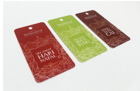
Gambar 16. Seasonal tag untuk shopping bag

bag terbuat dari kertas ivory, sedangkan kemasan kardus terbuat dari material corrugated paper . Pada kemasan tersier, informasi yang dicantumkan berupa logo Kampung Semanggi dan informasi mengenai media sosial dari Kampung Semanggi.