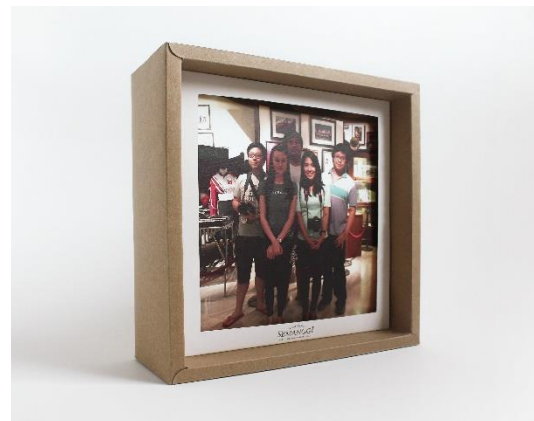
Gambar 14. Daur ulang kemasan sebagai bingkai foto