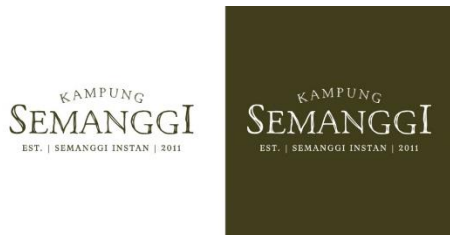
Gambar 6. Final logo aplikasi 2