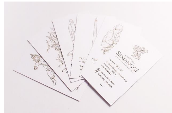
Gambar 19. Kartu nama

Promosi pada perancangan ini hanya sebagai penunjang untuk memperkenalkan produk semangi instan merek Kampung Semangi dengan tampilannya dan positioningnya yang baru di masyarakat, terutama kepada target market yang disasar. Setiap media promosi pada perancangan ini berhubungan langsung dengan produk dan brand Kampung Semangi itu sendiri. Melalui promosi, diharapkan masyarakat lebih mengenal produk semangi instan merek Kampung Semangi sebagai salah satu alternatif pilihan oleh-oleh khas Surabaya.