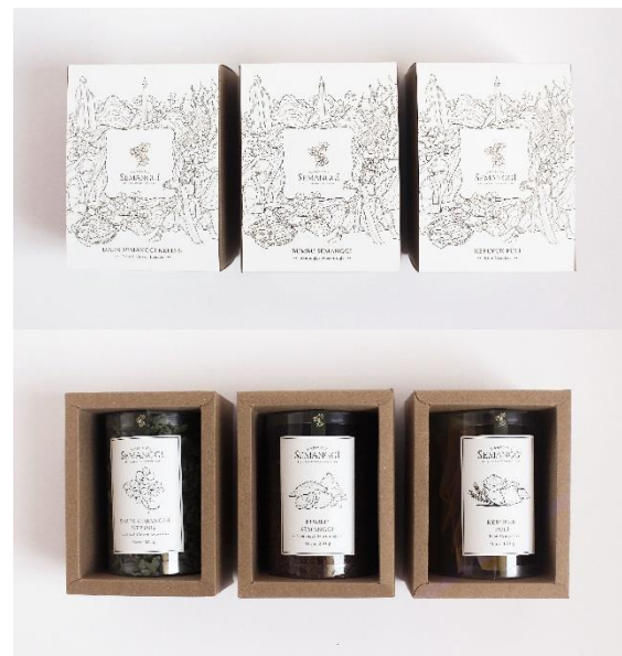
Gambar 10. Kemasan sekunder bahan-bahan semanggi instan

Kemasan paket semanggi instan memiliki kemasan seasonal yakni berupa label untuk menyesuaikan dan mengikuti event atau hari raya penting yang sedang berlangsung di Indonesia, seperti hari Natal, hari raya Idul Fitri dan Imlek. Kemasan sekunder baik kemasan bahan-bahan semanggi instan dan paket semanggi instan dapat digunakan kembali untuk turut berkontribusi pada lingkungan. Untuk kemasan sekunder bahan-bahan semanggi instan, setelah produk dikonsumsi, dapat dijadikan tempat penyimpanan alat-alat tulis, maupun benda-benda kecil lainnya. Sedangkan untuk kemasan sekunder dari paket semanggi instan, kemasan dapat diubah menjadi bingkai foto dengan mengikuti instruksi yang tertera pada kemasan.