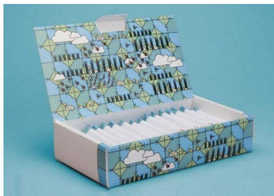
Gambar 2. Kemasan So Much More