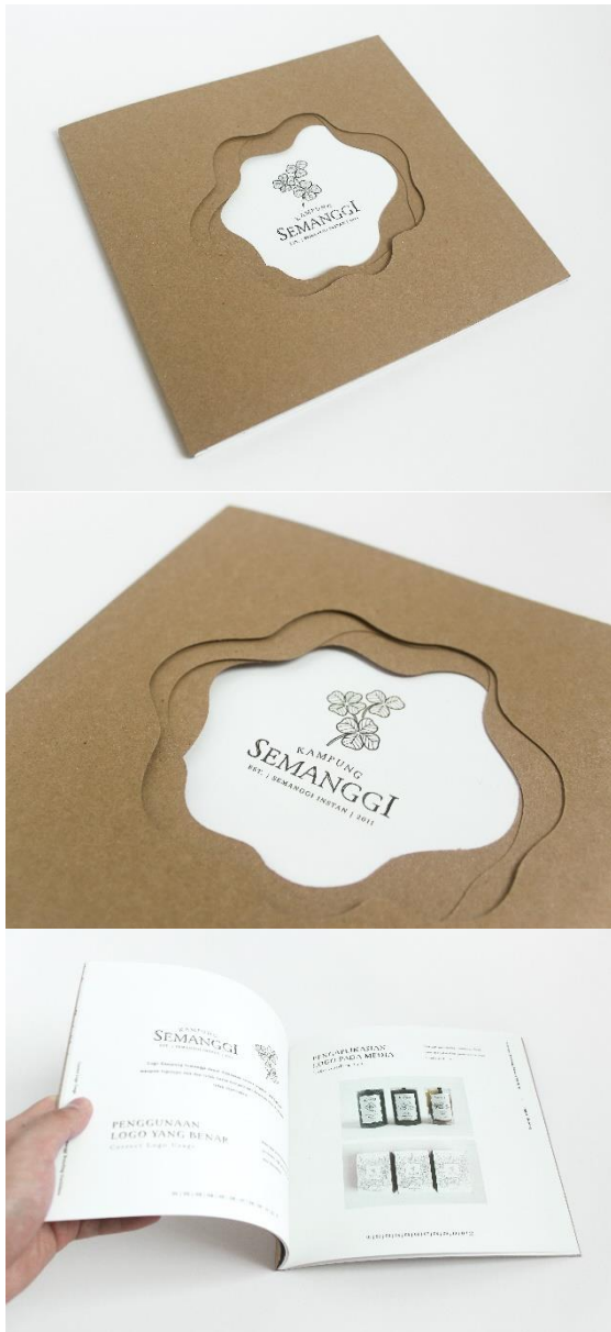
Gambar 23. Buku graphic standards manual