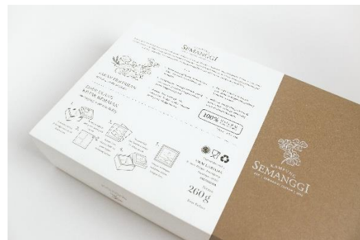
Gambar 13. Kemasan sekunder paket semangi instan bagian belakang