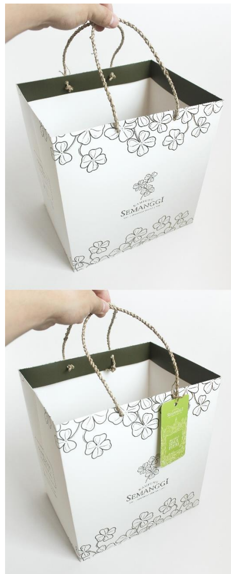
Gambar 17. Kemasan tersier shopping bag besar