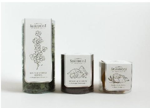
Gambar 9. Kemasan primer paket semanggi instan