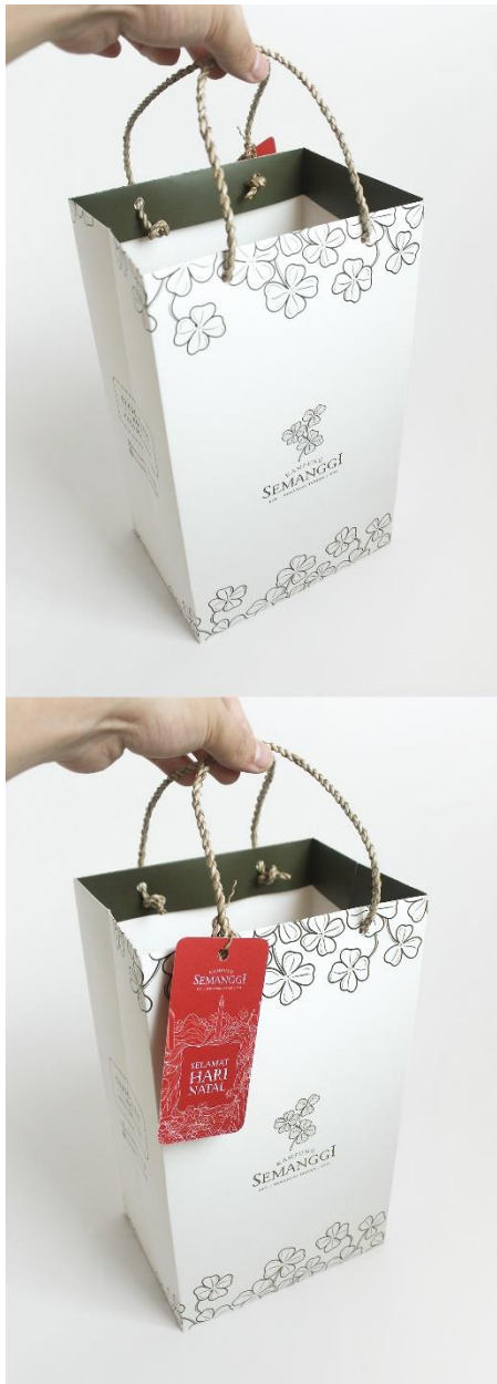
Gambar 18. Kemasan tersier shopping bag kecil