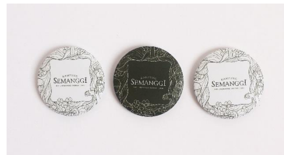
Gambar 20. Pin