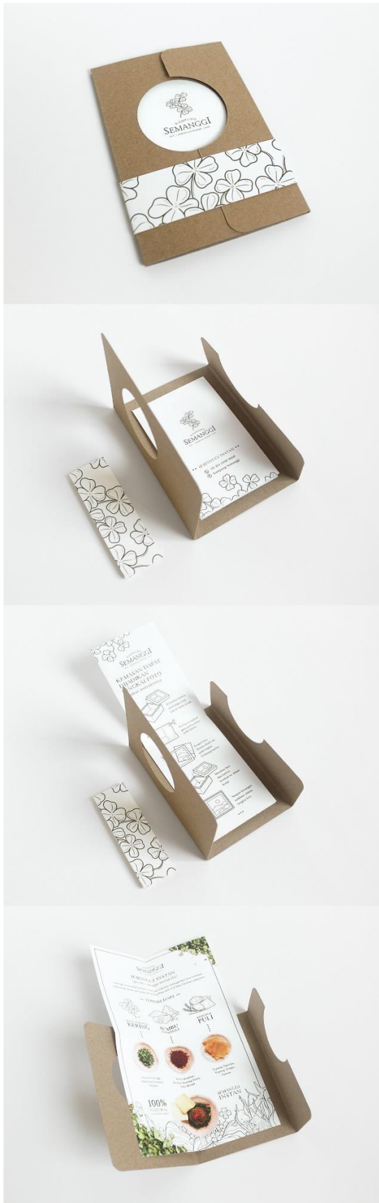
Gambar 21. Brosur