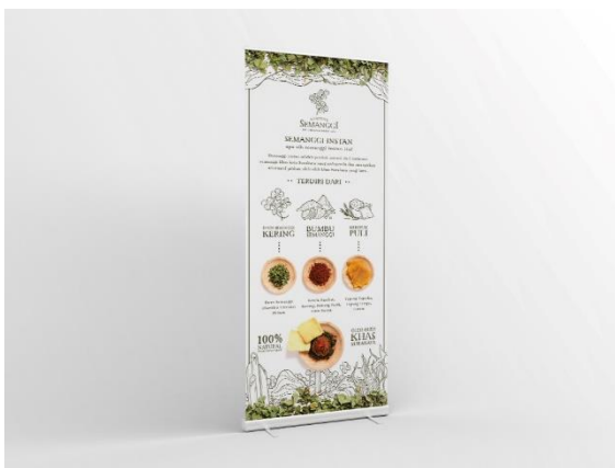
Gambar 24. Banner