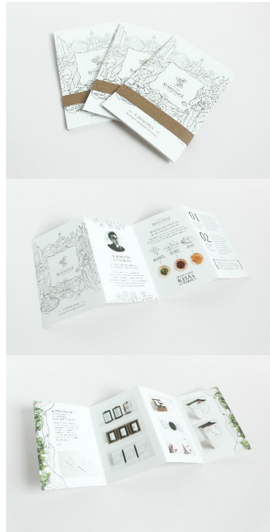
Gambar 25. Katalog perancangan kemasan