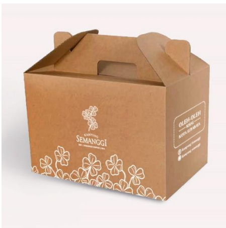
Gambar 18. Kemasan tersier kardus