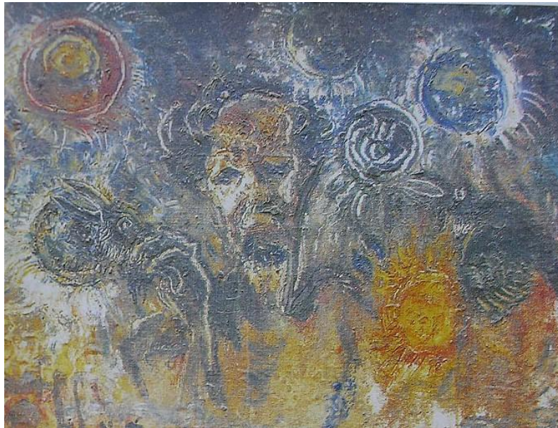
Gambar1 Potret Diri dan Tujuh Matahari di India, 1950 Cat minyak di atas kanvas, 124,5 X 95 cm