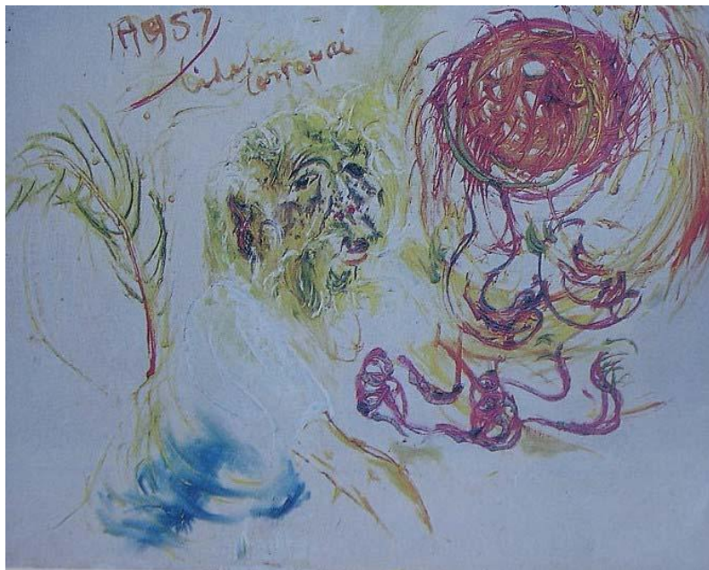
Gambar 2 Potret Diri tak Tercapai , 1987 Cat minyak di atas kanvas, 130,5 X 98,5 cm Sumber: Raka Sumichan dan Umar Kayam, Affandi , Yayasan Bina Lestari Budaya, Jakarta, 1987. (Foto: Agus Priyatno)