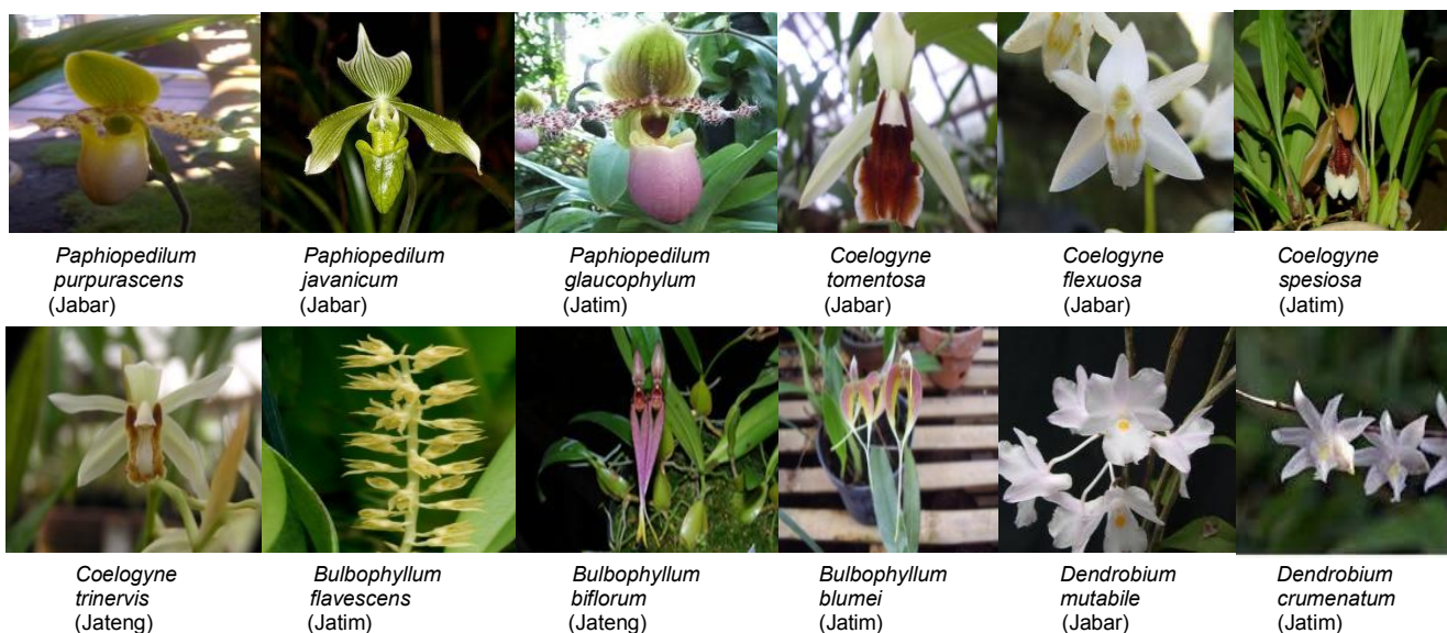
Gambar 1. Bahan tanaman 12 anggrek asal Jawa Tengah, Jawa Timur dan Jawa Barat.

Bermawie (2005) menyatakan bahwa karakterisasi merupakan suatu kegiatan dalam konservasi plasma nutfah untuk mengetahui sifat morfologi yang dapat dimanfaatkan dalam membedakan antaraksesi, menilai besarnya keragaman genetik, mengidentifikasi varietas menilai jumlah aksesi dan sebagainya. Batang anggrek diamati berdasarkan tipe pertumbuhan. Ada 2 tipe pertumbuhan anggrek yaitu monopodial dan simpodial. Batang monopodial merupakan batang yang memanjang ke atas dan hanya terdapat satu batang, sedangkan batang simpodial merupakan batang ke