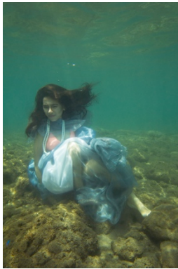
Gambar 18. Hasil edit Kima raksasa