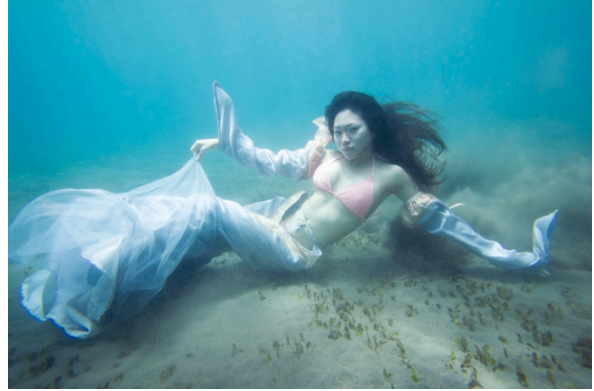
Gambar 7. Hasil edit Dugong 1