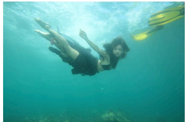
Gambar 2. Coelacanth 2

Pada proses pemotretan model mengalami kesulitan untuk mengatur pernafasan tetapi pose untuk setiap frame bagus dan helper pada beberapa foto ikut masuk ke dalam frame foto. Cuaca untuk pada saat pemotretan bagus akan tetapi beberapa saat sebelum sesi pemotretan berakhir arus laut kencang.