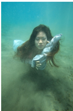
Gambar 6. Dugong 2