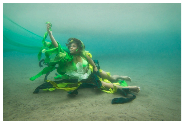
Gambar 24. Hasil edit Tumbuhan laut

Pada sesi pemotretan tema tumbuhan laut ini model sangat baik dalam pernafasan, dan untuk pose baik. Keadaan laut dan cuaca baik untuk sesi pemotretan.