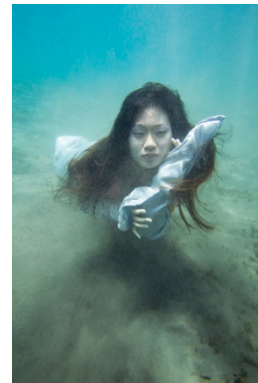
Gambar 8. Hasil edit Dugong 2