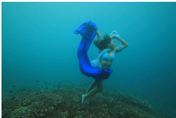
Gambar 21. Hiu karang

Pada proses pemotretan tema hiu karang ini model dapat melakukan pose dengan baik, dan laut juga tidak ada arus walaupun dalam keadaan hujan dan pemotretan di lokasi paling dalam.