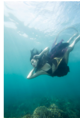
Gambar 3. Hasil edit Coelacanth 1

Pada proses pemotretan model mengalami kesulitan untuk mengatur pernafasan tetapi pose untuk setiap frame bagus dan helper pada beberapa foto ikut masuk ke dalam frame foto. Cuaca untuk pada saat pemotretan bagus akan tetapi beberapa saat sebelum sesi pemotretan berakhir arus laut kencang.