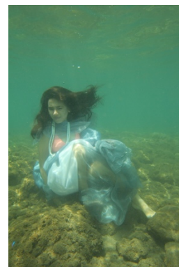
Gambar 17. Kima raksasa

Pada proses pemotretan ini model kurang bisa melakukan pose dengan baik. Dan kondisi laut tenang, tetapi jarak pandang kurang.