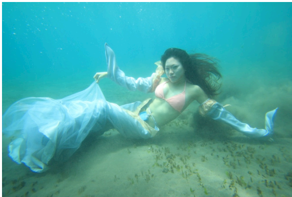
Gambar 5. Dugong 1