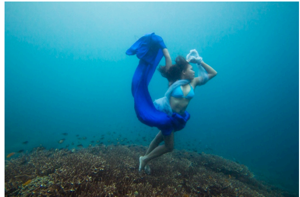
Gambar 22. Hasil edit Hiu karang

Pada proses pemotretan tema hiu karang ini model dapat melakukan pose dengan baik, dan laut juga tidak ada arus walaupun dalam keadaan hujan dan pemotretan di lokasi paling dalam.