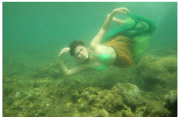
Gambar 10. Penyu 2

Pada pemotretan tema Duyung ini dilakukan dua kali dengan model yang berbeda, karena pada sesi pemotretan yang pertama arus laut sangat kencang dan model kurang bisa pose dengan baik. Pada pemotretan kedua, model bisa melakukan pose dengan baik, mendengarkan arahan dengan baik, dan pernafasan yang baik. Untuk kondisi laut juga sangat bagus, air tenang dan warna laut jernih.