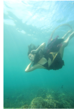
Gambar 1. Coelacanth 1