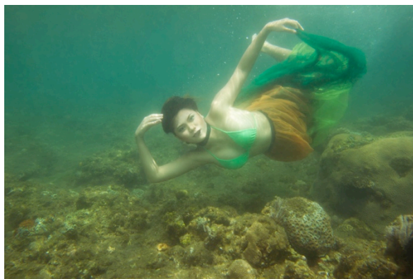
Gambar 12. Hasil edit Penyu 2