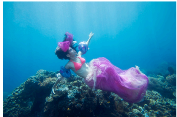
Gambar 16. Hasil edit Terumbu karang 2