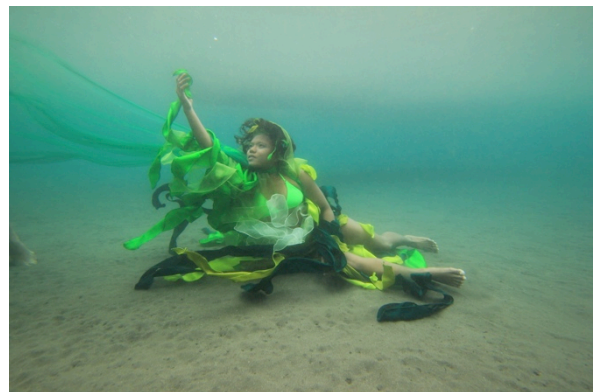
Gambar 23. Tumbuhan laut

Pada sesi pemotretan tema tumbuhan laut ini model sangat baik dalam pernafasan, dan untuk pose baik. Keadaan laut dan cuaca baik untuk sesi pemotretan.