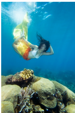
Gambar 20. Hasil edit Kuda laut Walea

Pada proses pemotretan tema Kuda laut ini berjalan lancar dan baik dari model , asisten, helper , keadaan laut dan cuaca. Hanya saja salah satu properti foto (aksesoris ditangan) hilang dan hanyut.