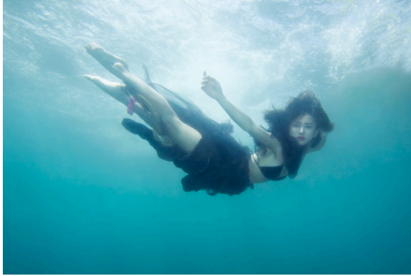
Gambar 4. Hasil edit Coelacanth 2