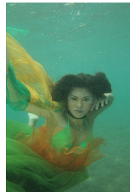
Gambar 9. Penyu 1

Pada pemotretan tema Duyung ini dilakukan dua kali dengan model yang berbeda, karena pada sesi pemotretan yang pertama arus laut sangat kencang dan model kurang bisa pose dengan baik. Pada pemotretan kedua, model bisa melakukan pose dengan baik, mendengarkan arahan dengan baik, dan pernafasan yang baik. Untuk kondisi laut juga sangat bagus, air tenang dan warna laut jernih.