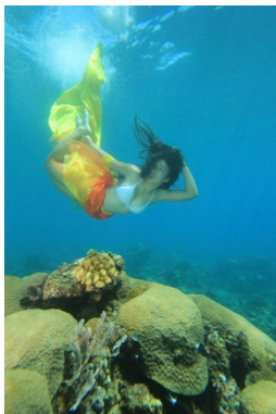
Gambar 19. Kuda laut Walea

Pada proses pemotretan tema Kuda laut ini berjalan lancar dan baik dari model , asisten, helper , keadaan laut dan cuaca. Hanya saja salah satu properti foto (aksesoris ditangan) hilang dan hanyut.