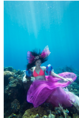
Gambar 15. Hasil edit Terumbu karang 1

Pada proses pemotretan tema Penyu ini, model dapat mengikuti arahan dengan baik, keadaan laut dan cuaca juga bersahabat. Tetapi sedikit terhambat karena fotografer dan asisten terkena karang api dan harus berpindah tempat karena banyaknya bulu babi.