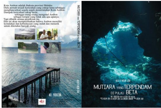
Gambar 2. Cover DVD dari film dokumenter yang berjudul Mutiara yang Terpendam di pulau Beta