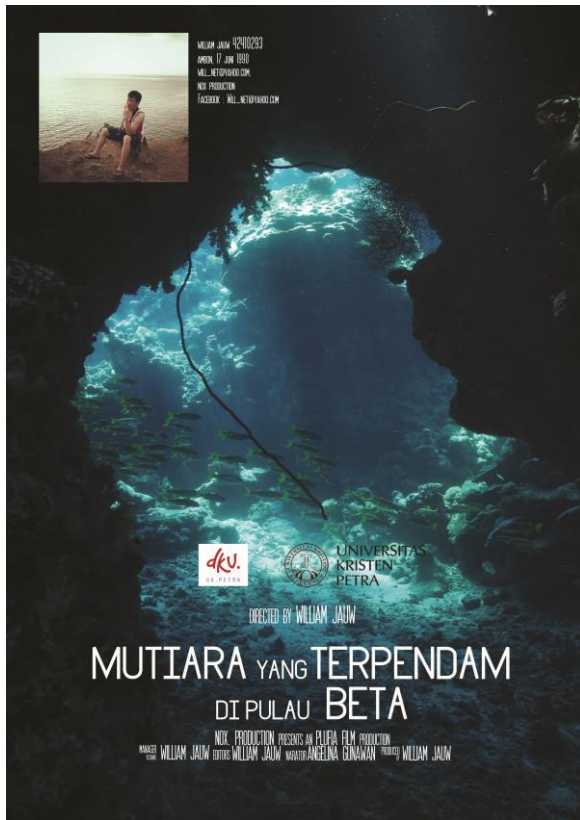
Gambar 6. Trailer dari film dokumenter yang berjudul Mutiara yang Terpendam di pulau Beta