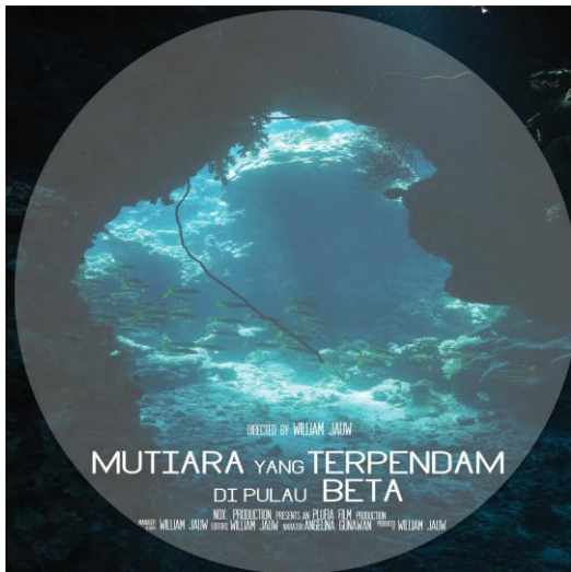
Gambar 3. Label DVD dari film dokumenter yang berjudul Mutiara yang Terpendam di pulau Beta